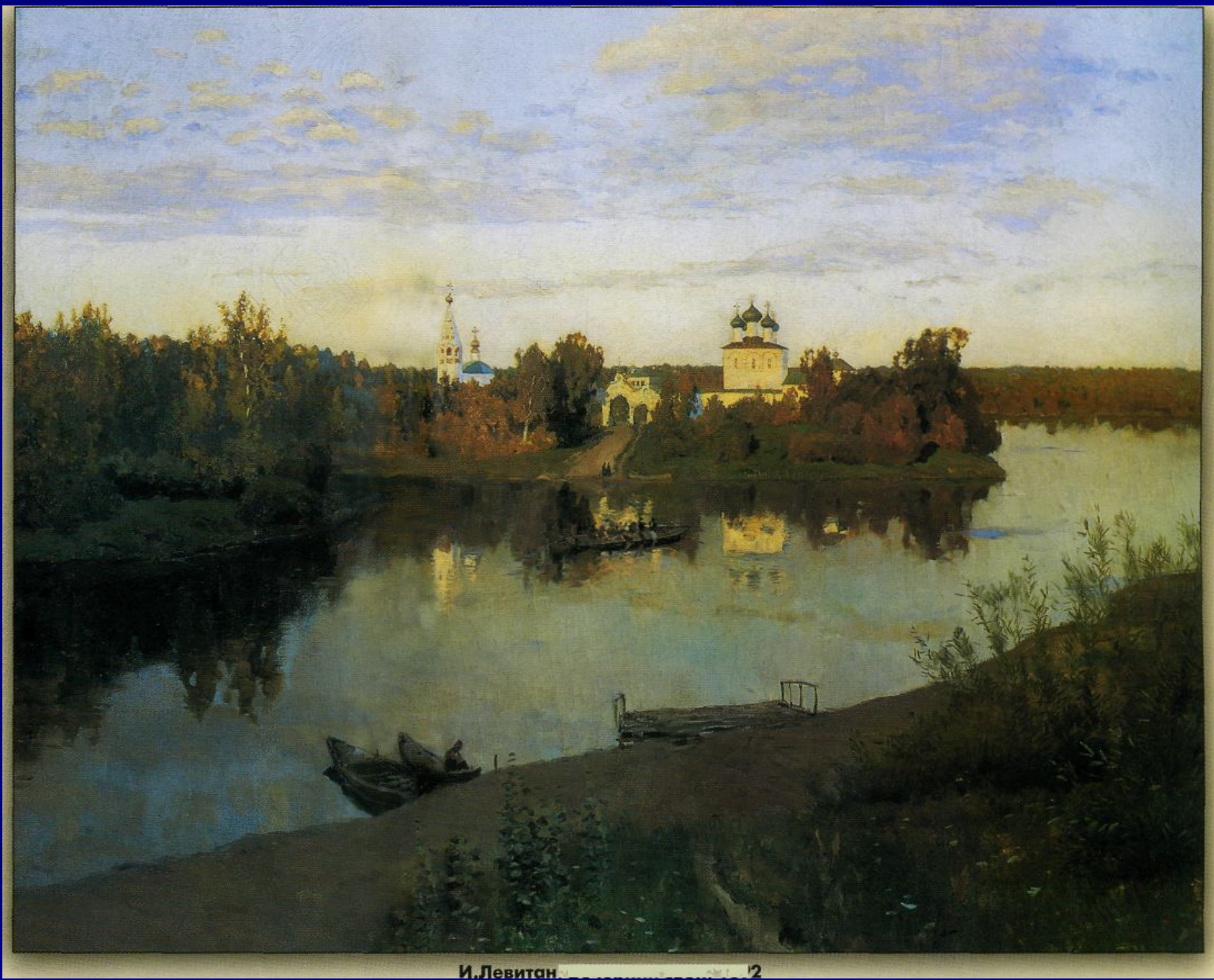
И. Левитан. Церковь в лесу. 1892