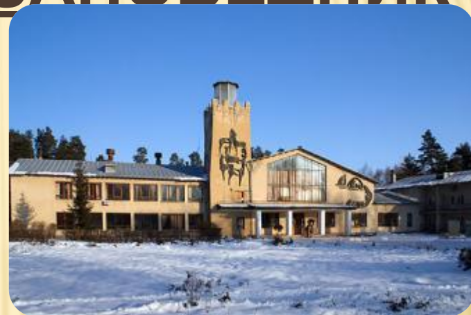
Центральная усадьба заповедника