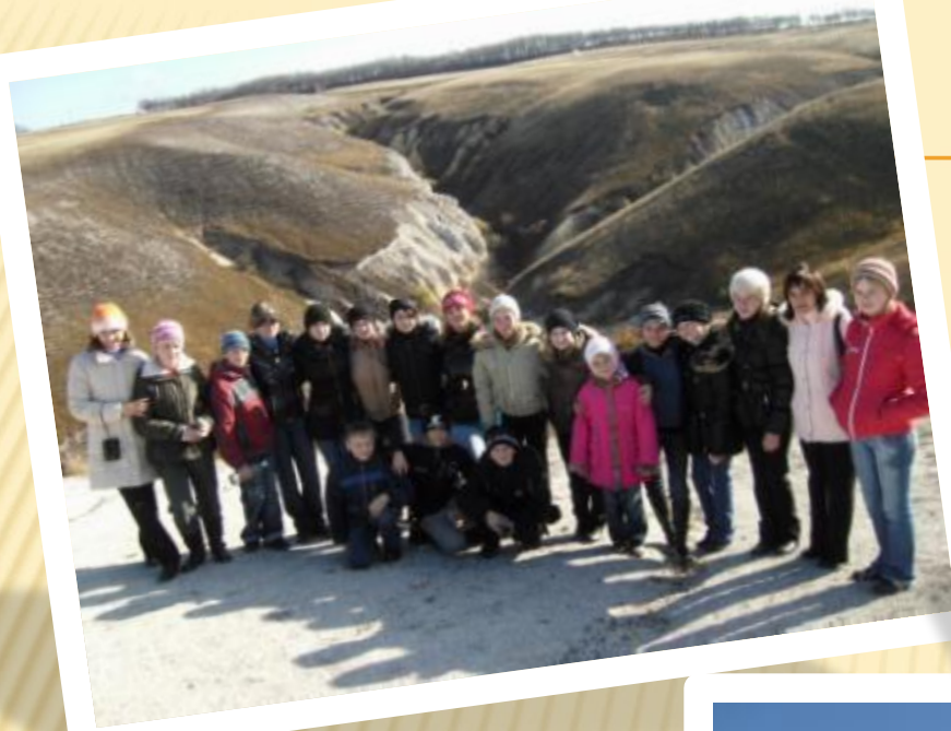
Нас потрясла красота Дивногорья!