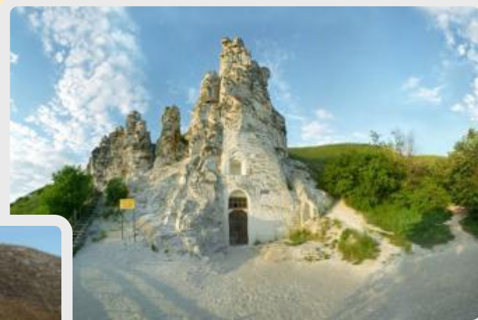
Меловая пещерная церковь