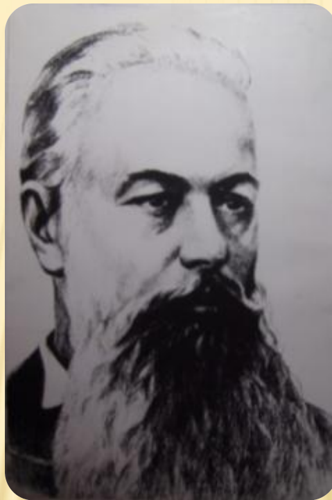
В. В. Докучаев