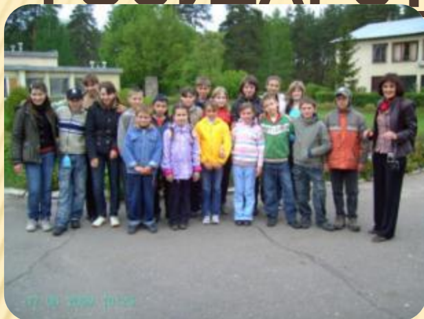
На экскурсии в заповеднике