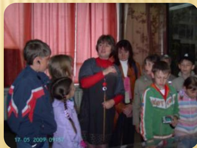
В залах музея