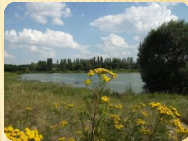
Пруды Каменной Степи