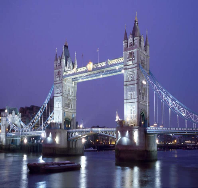
London Bridge at night