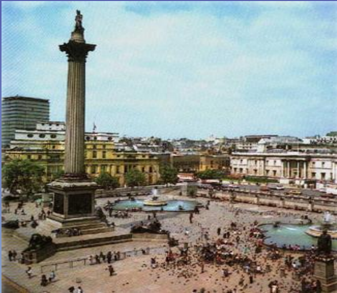
Trafalgar square in the centre of London with the statue of Nelson.