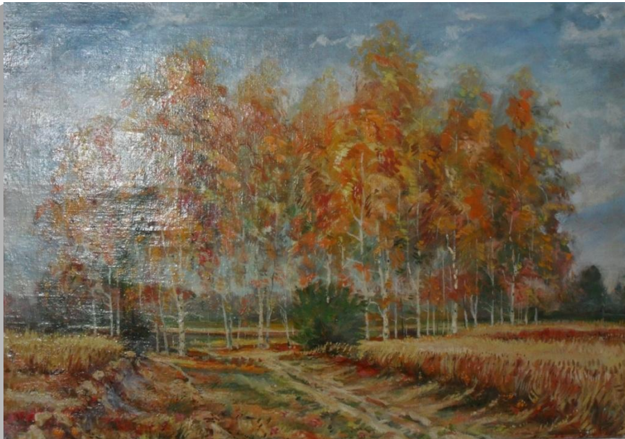
Артюшенко А.Т. «Берёзовая роща» 1980г.