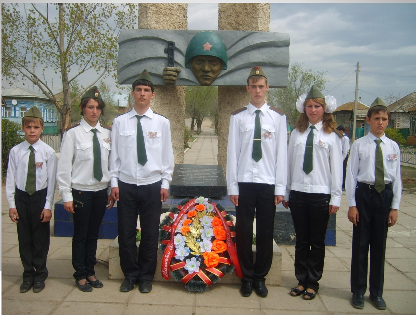
ПОМС – поисковый отряд молодых следопытов МОУ «Капустиноярская СОШ МО «Ахтубинский район». Вахта памяти 30 апреля 2009 года.