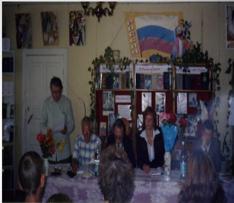
Встреча в литературной гостиной сельской библиотеки.