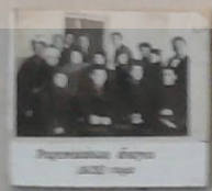
Первый директор 1952 год