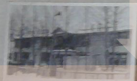
Здание сушильного бара