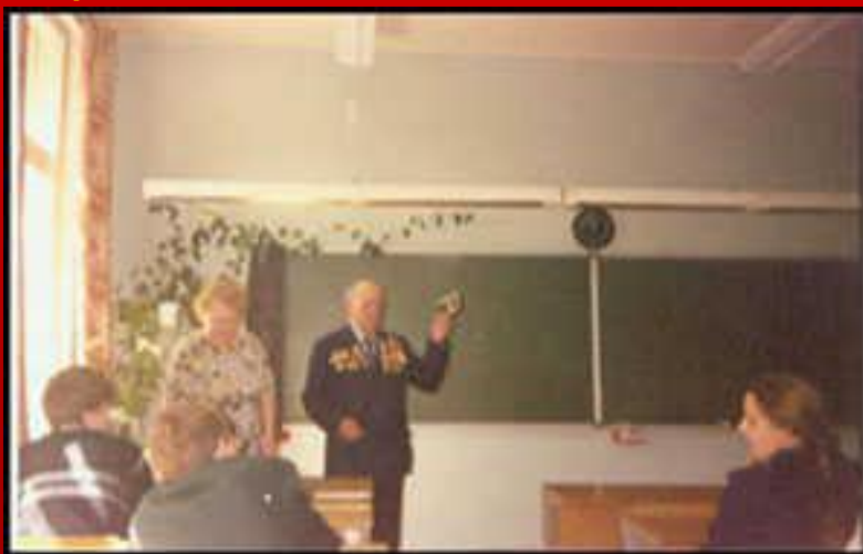
◀ Урок мужества, 2000 г.