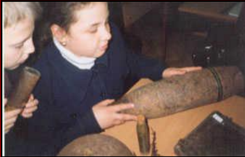
Ученики осматривают экспонаты ▲