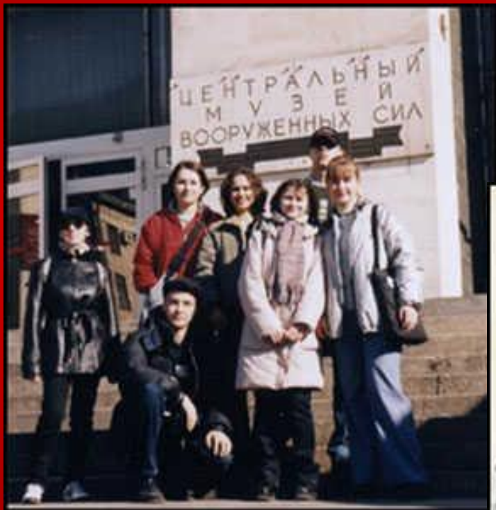
▲ У Центрального Музея ВС