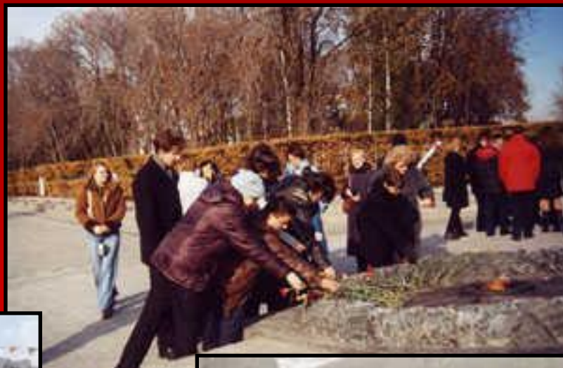
Возложение цветов к могиле Неизвестного Солдата в г. Киеве