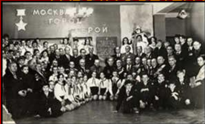
▲ С ветеранами 436 с.п., 1974 год