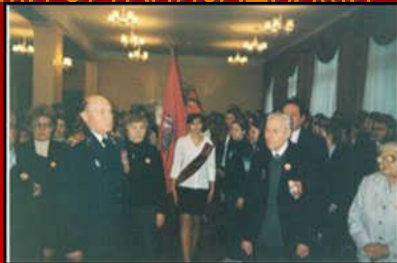
55-летие Победы, гимназия №1522, 2000 год ▲