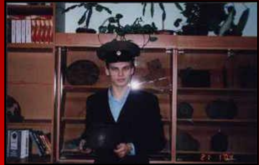
Создание музейной экспозиции