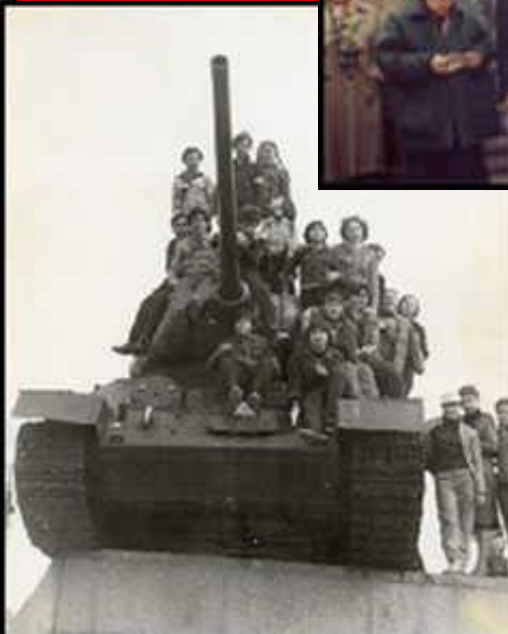
◀ В Курске