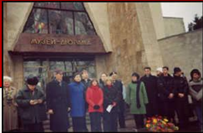
▲ Музей в Киеве