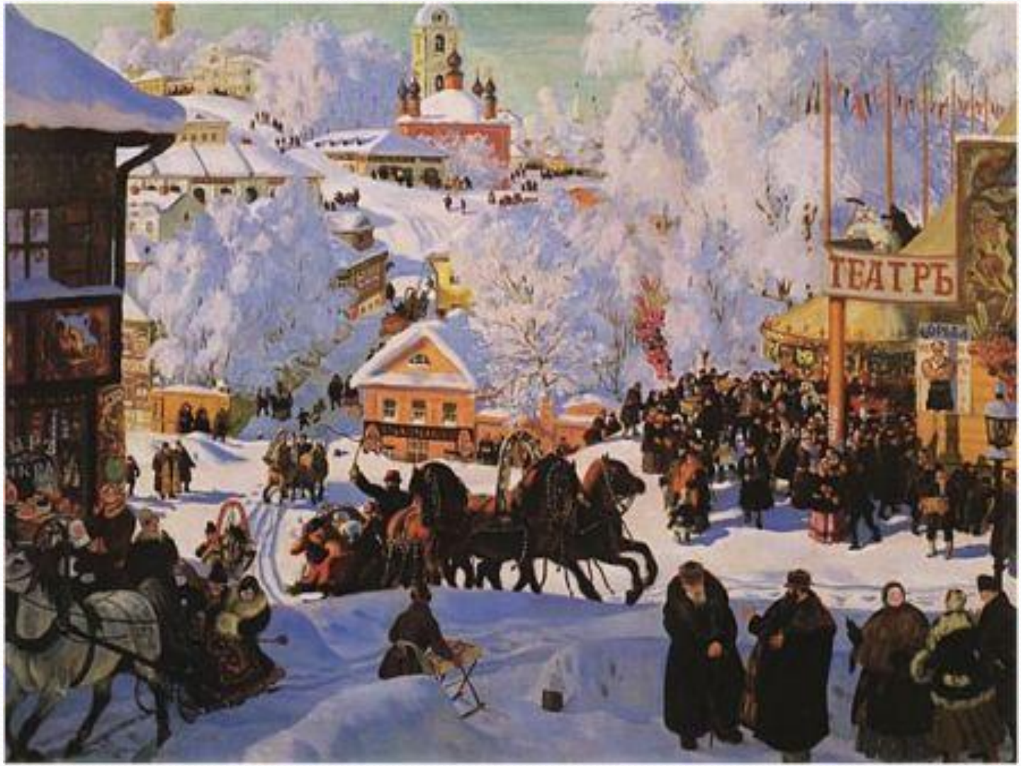
Кустодиев, Зима. Мас., 1904 год. ГТГ.