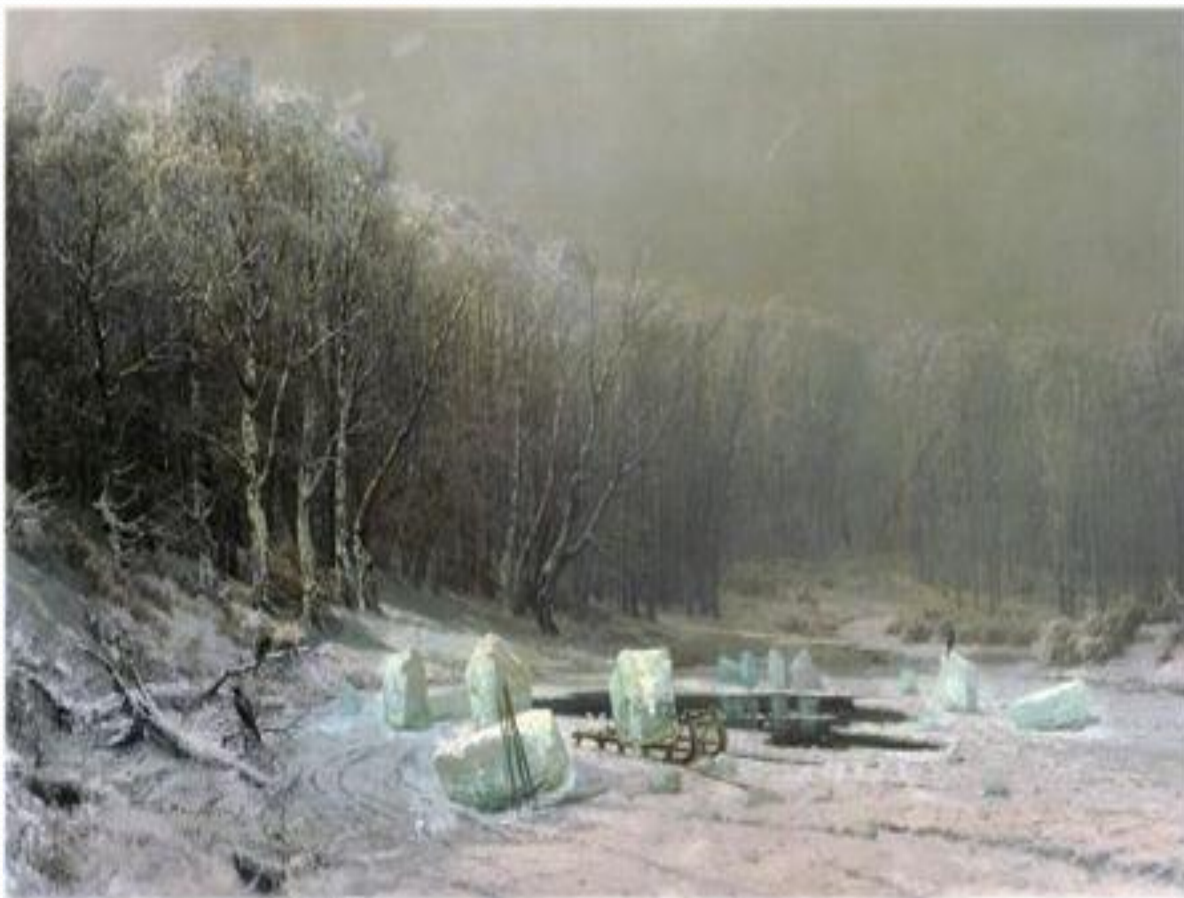
А. Мещеряков. Зима. Ледокол.