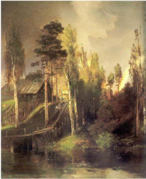
А.К.Саврасов «У ворот монастыря»

Среди дубравы Блестит крестами Храм пятиглавый С колоколами.