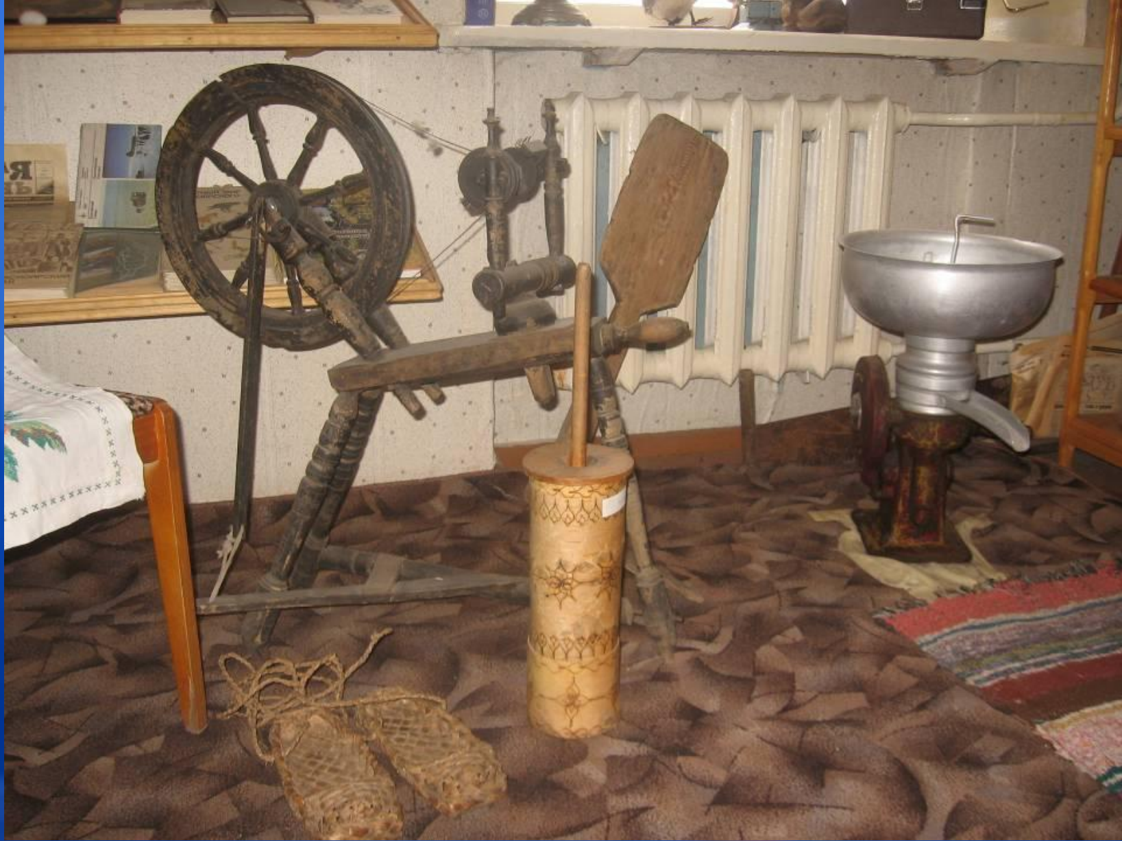
Прялка XIX века