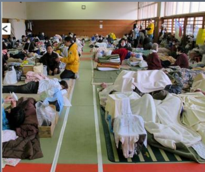
Добровольные священники помогают в лагере для эвакуированных.