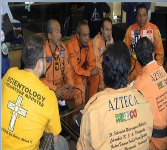
Группа мексиканских спасателей Лос-Тонос в Мексике. Вместе с добровольным священником решают как организовать свое прибытие в Японию. С момента катастрофы прошло менее 24 часов