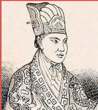
Хун Сюцюань (1814-1864) Вождь тайпинов