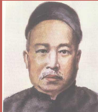
Кан Ювэй (1858-1927) Лидер реформаторов