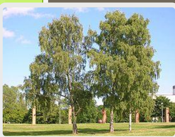
Берёза повислая или бородавчатая