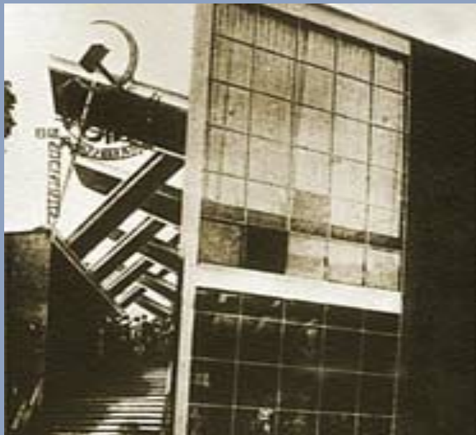
Павильон СССР на выставке в Париже