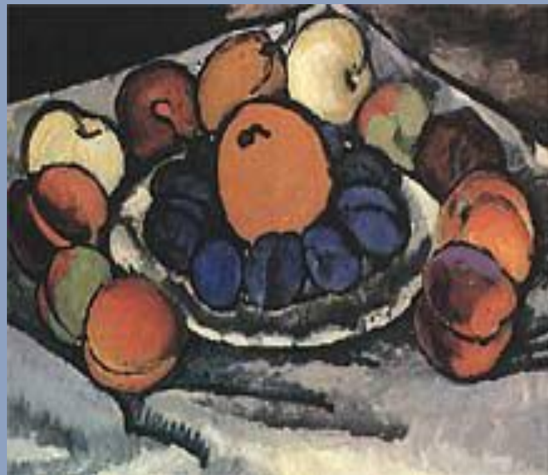
«ФРУКТЫ НА БЛЮДЕ»