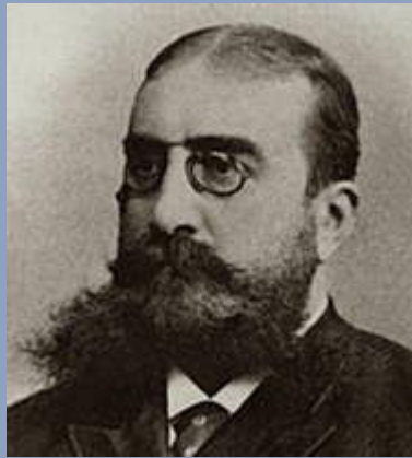
В.И. НЕМИРОВИЧ- ДАНЧЕНКО