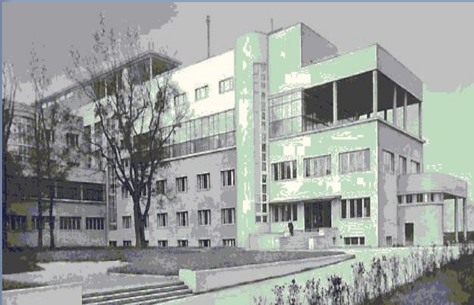
Дворец Культуры ЗИЛ