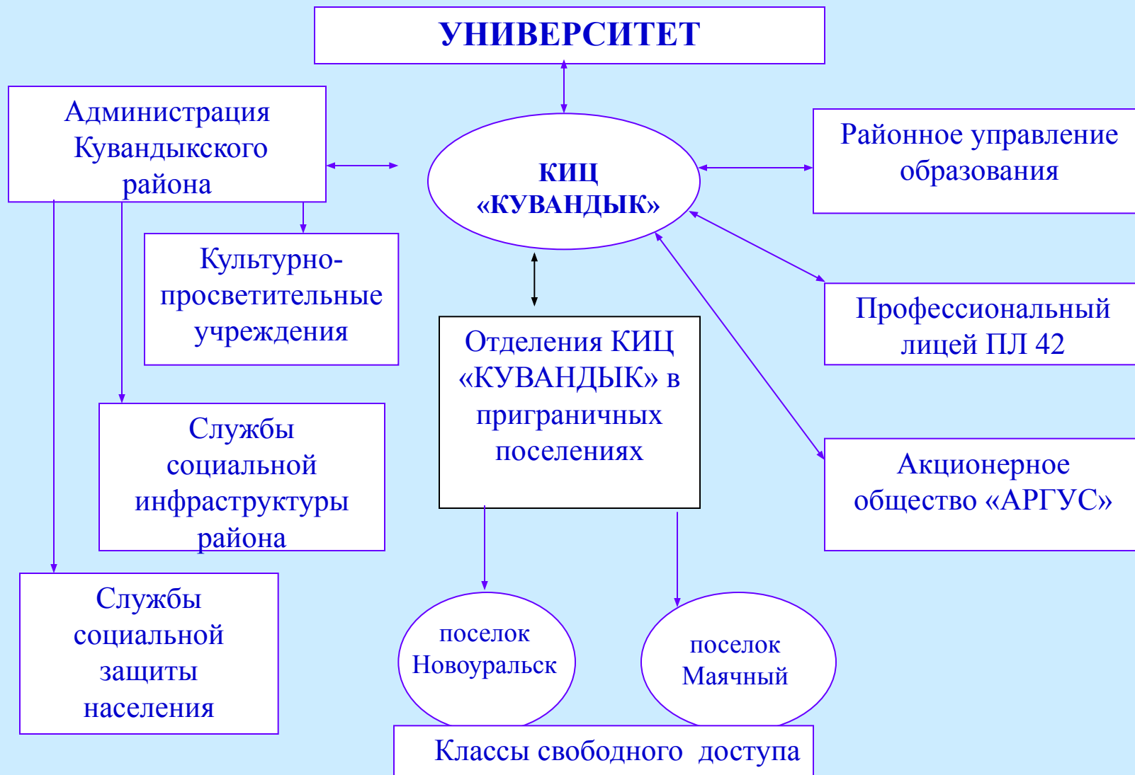
Схема взаимодействия университета с культурно-информационным центром (КИЦ) «КУВАНДЫК»