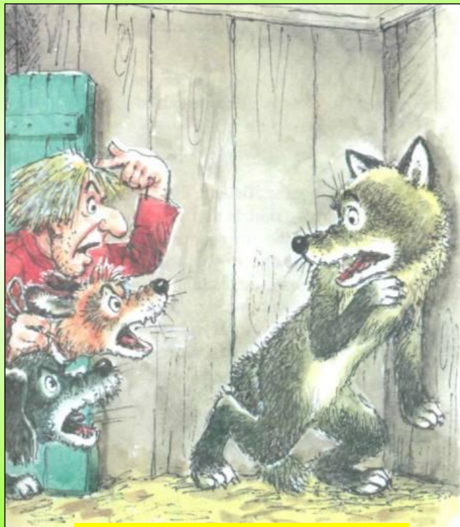
Художник А. М. Савченко