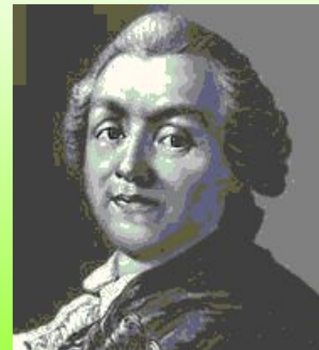
А. П. Сумароков