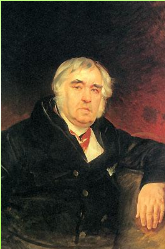
И. А. Крылов