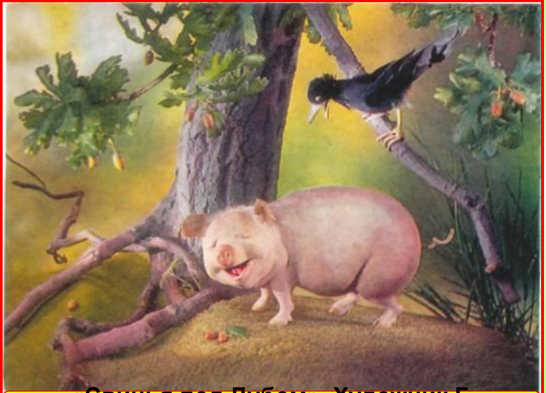
«Свинья под Дубом». Художник Г. Куприянов