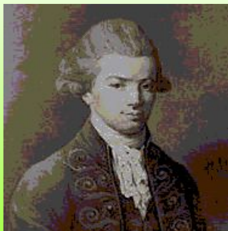
И. И. Хемницер