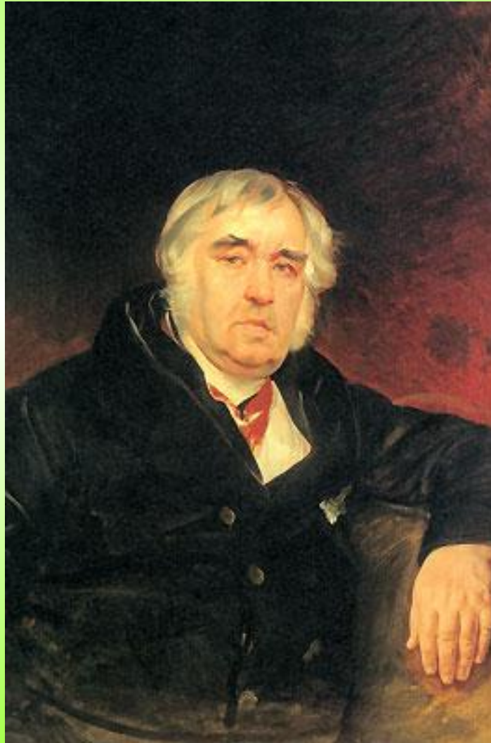
И. А. Крылов