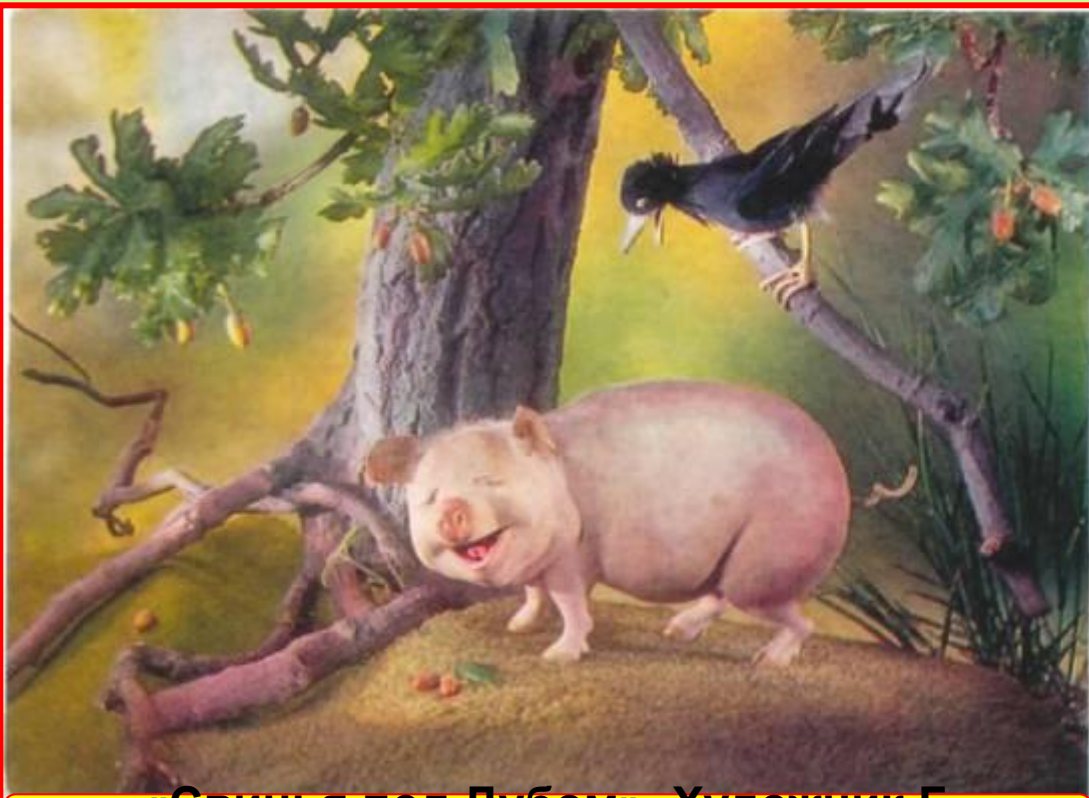
«Свинья под Дубом». Художник Г. Куприянов