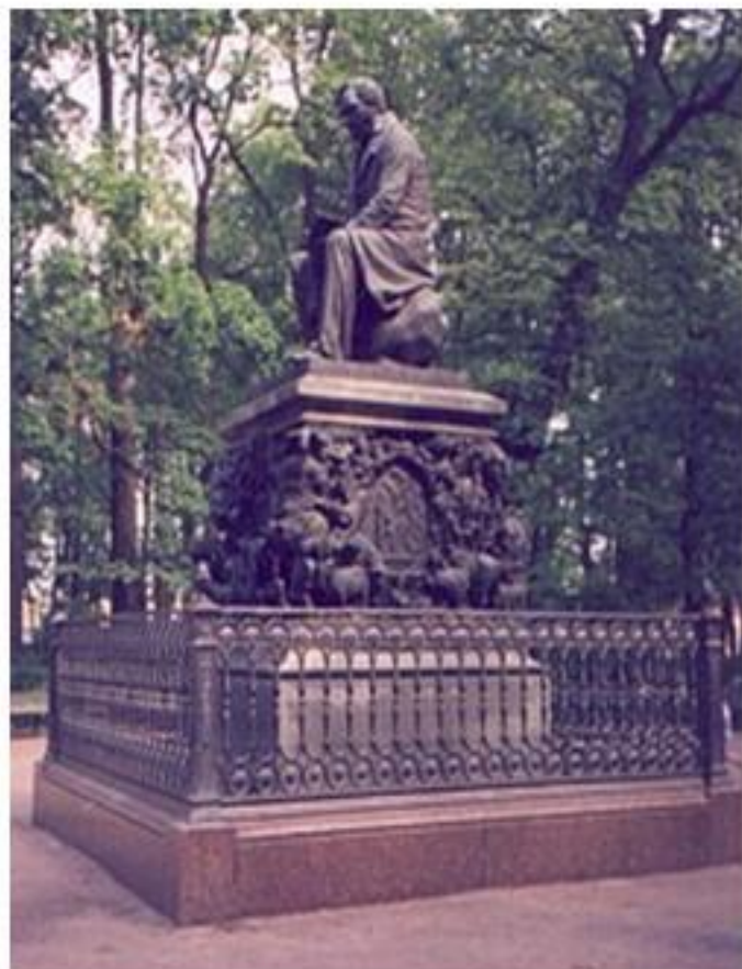
ПАМЯТНИК И. А. КРЫЛОВУ В ЛЕТНЕМ САДУ, САНКТ-ПЕТЕРБУРГ