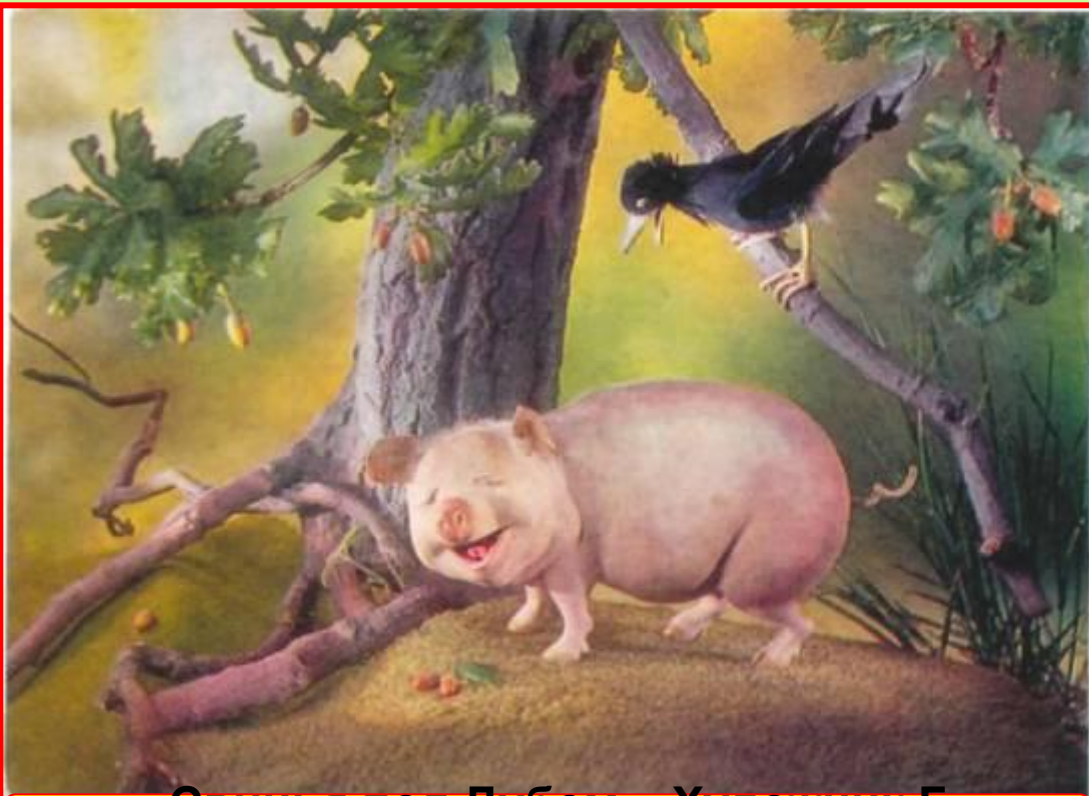
«Свинья под Дубом». Художник Г. Куприянов