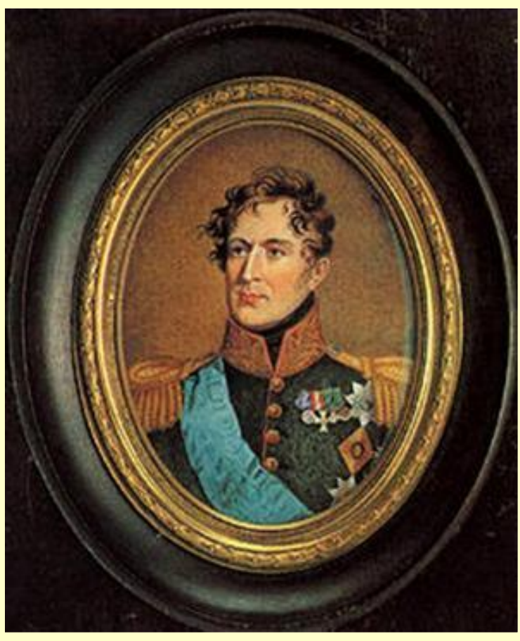
Генерал Милорадович.

В середине дня Николай решил вступить с ними в переговоры, но митрополит был отогнанан выстрелами, а генерал-губернатора Петербурга,героя войны 1812 г. ген. Милорадовича П. Каховский застрелил из