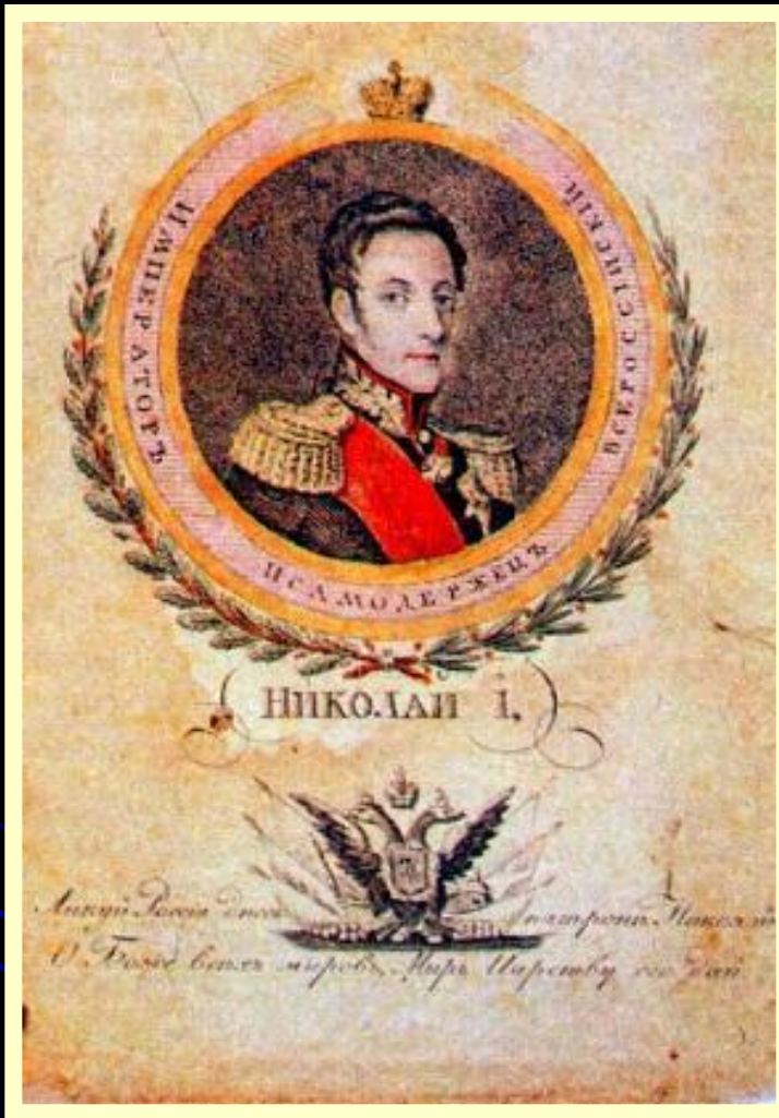
Листовка выпущенная К коронации Николая I.

Рано утром 14 декабря декабристы отправились по своим полкам, но лишь Н. Бестужеву и Дм. Ростовскому-Шеппину удалось вывести на Сенатскую площадь Московский полк.