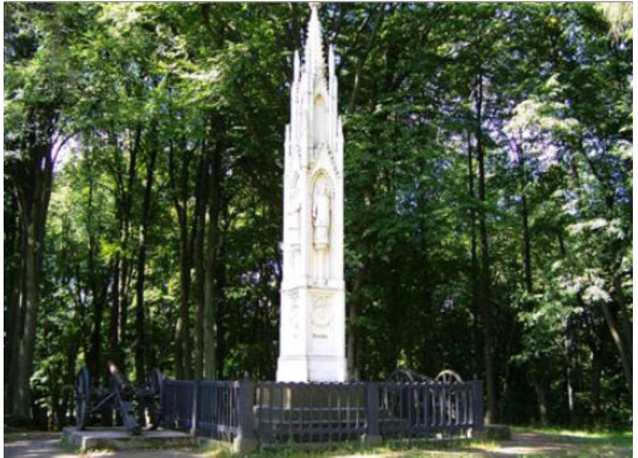
Памятник в честь сражения при Прейсиш-Эйлау

Начинается история памятника с 1851 года. Именно тогда возникла идея увековечить сражение между союзными русско-прусскими войсками и французской армией, произошедшее у Прейсиш-Эйлау 7-8 февраля 1807 года.