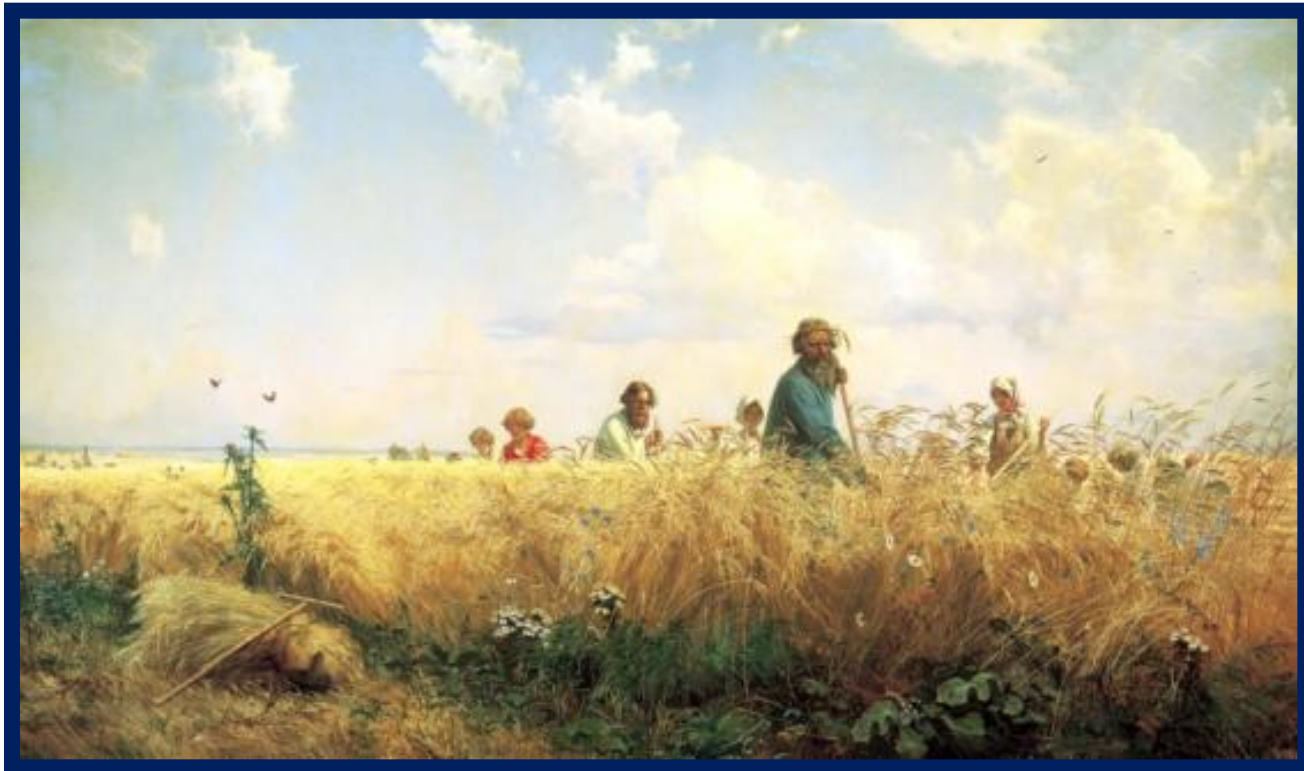
Г. Г. Мясоедов «Косцы»

5) Они косили и пели, и весь берёзовый лес, ещё не утративший густоты и свежести, звучно откликался им.