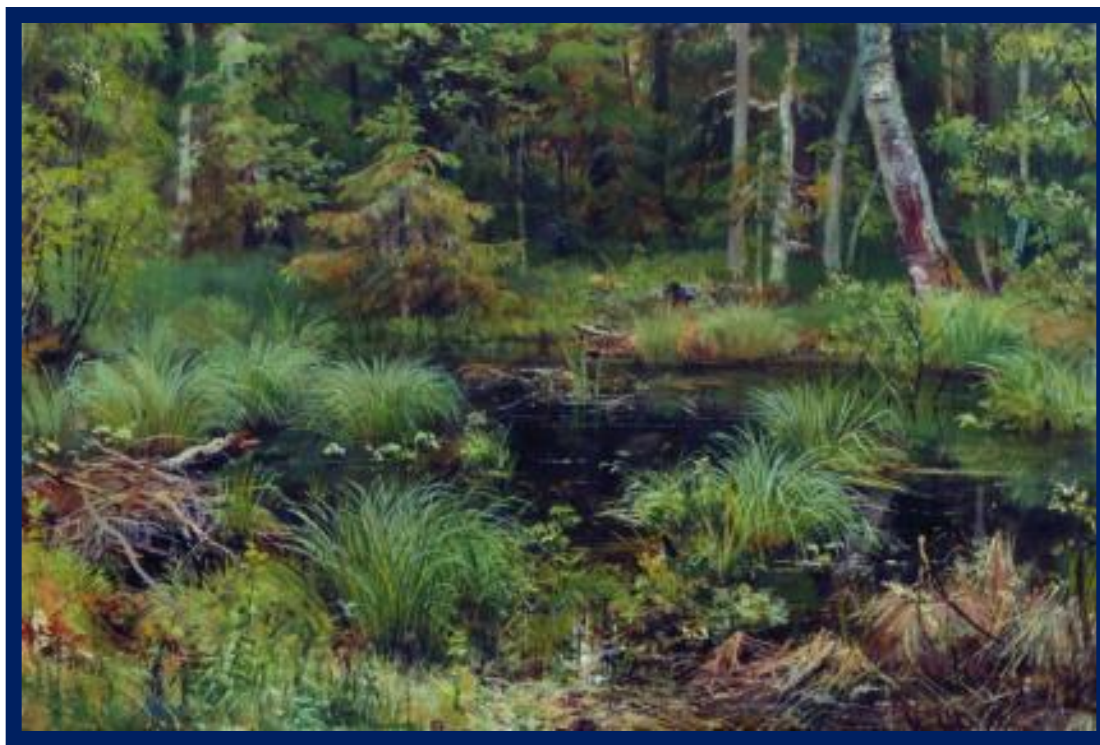
И. И. Шишкин «Родник в лесу»

4) Кипит, играет и спешит, Крутясь хрустальными клубами, И под ветвистыми дубами Стеклом расплавленным бежит.