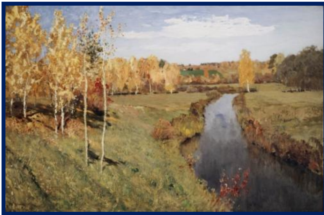
И. И. Левитан «Золотая осень»

7) Чуть показавшееся сзади солнце озаряло осыпанные золотом вершины белоствольных берёз.