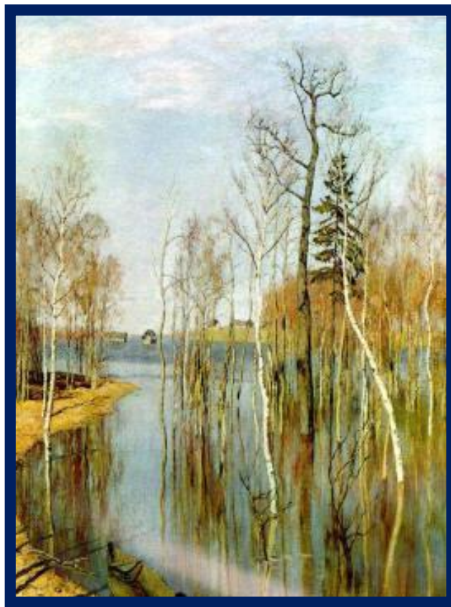
И. И. Левитан «Весна. Большая вода»

2. Прелестный, неуловимо-лиловатый тон был в этих белых с золотом вершинах, сквозивших на лазури.