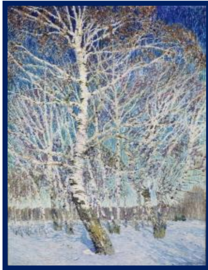
И. Э. Грабарь «Февральская лазурь»

б) Над глубокими свежими снегами, завалившими чаши деревьев, синее, огромное и удивительно нежное небо.