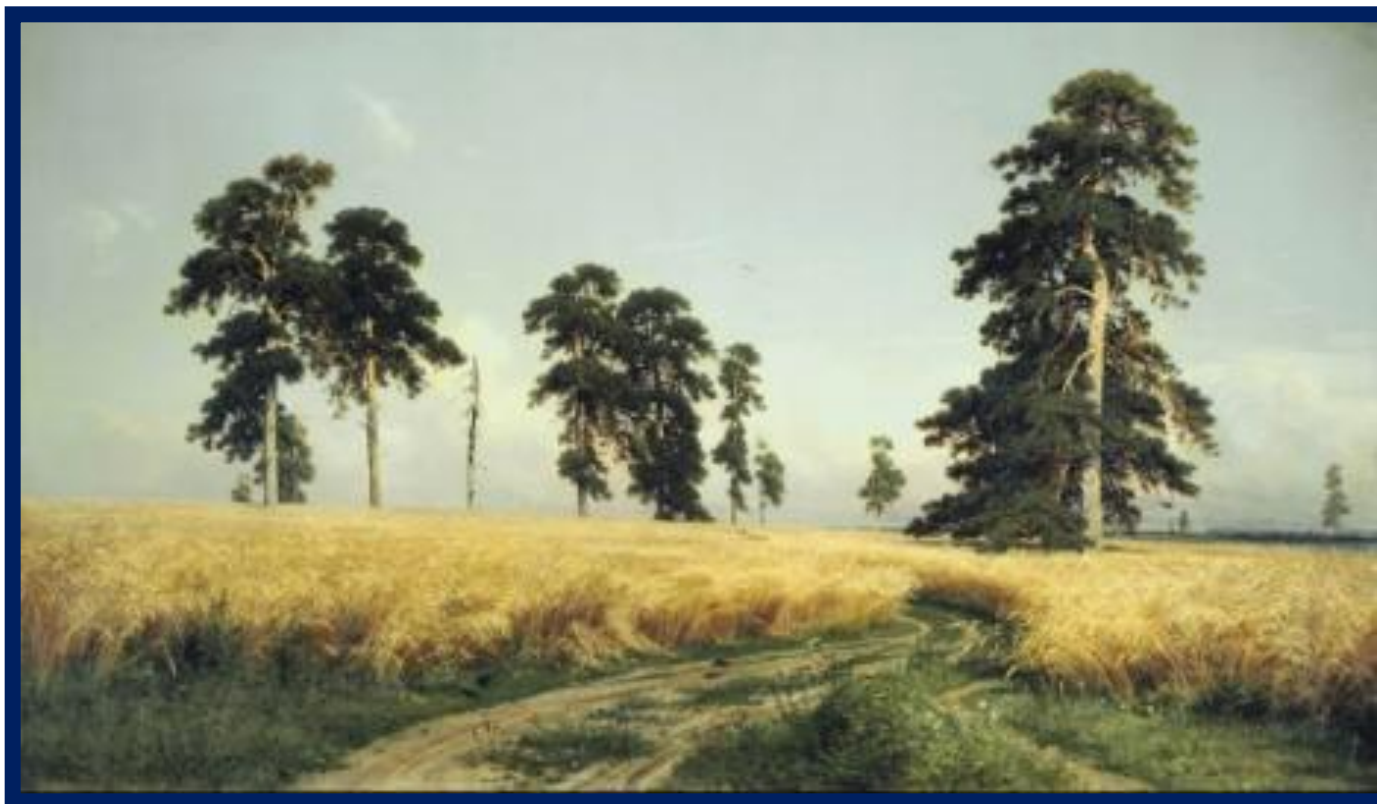
И. И. Шишкин «Рожь»

1) Старая дорога, заросшая кудрявой муравой, уходила в бесконечную русскую даль.