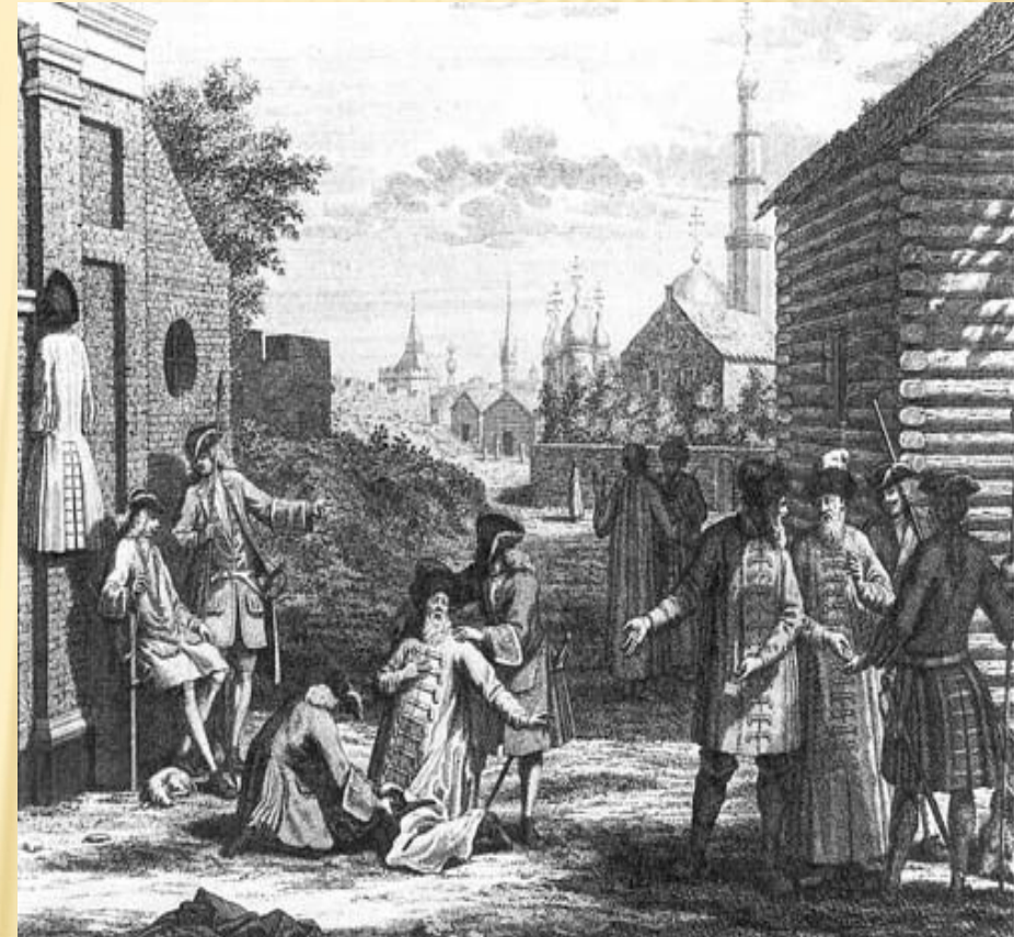
«Укорочение кафтанов на заставе»