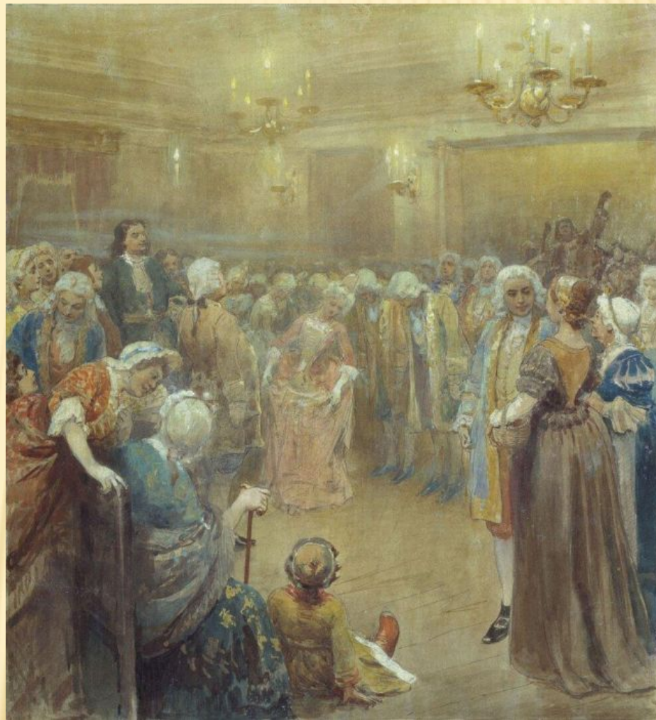
ПЕТР I НА АССАМБЛЕЕ

По замыслу Петра на ассамблеях должна была царить непринужденная обстановка. Каждый из гостей мог заниматься тем, чем ему хотелось: танцевать, вести беседы, причем, часто деловые, играть в шахматы