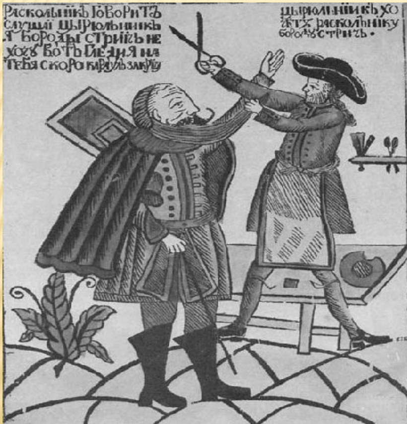
«Цирюльник стрижет раскольника»