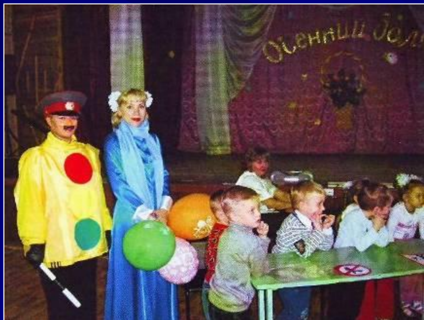
Развлечение по ПДД