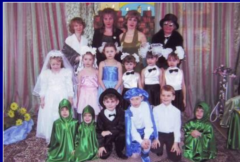
Мюзикл «Новые приключения Дюймовочки»