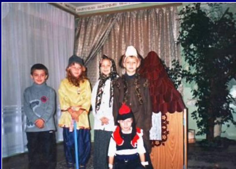
Марийская сказка «Собака и дятел»