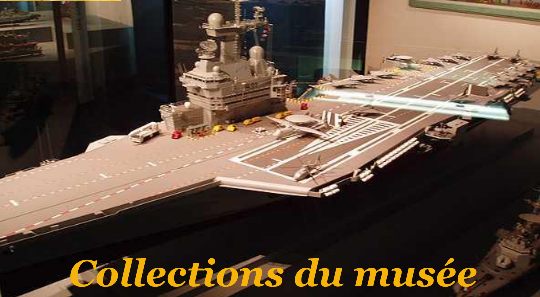
Collections du musée