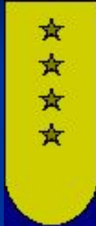
Погон адмирала флота

АДМИРАЛ (нидерл. admiraal , от араб. амир аль бахр — владыка на море), воинское звание (чин) в военно-морских флотах. В России адмиральские чины установлены Петром I в кон. 17 — нач. 18 вв. С 1940 существуют звания: контр-адмирал, вице-адмирал, адмирал, адмирал флота (соответствуют званиям генерал-майор, генерал-лейтенант, генерал-полковник, генерал армии), которые сохранились и в Российской Федерации; с 1955 было звание адмирала Флота Советского Союза (соответствовало званию Маршала Советского Союза).