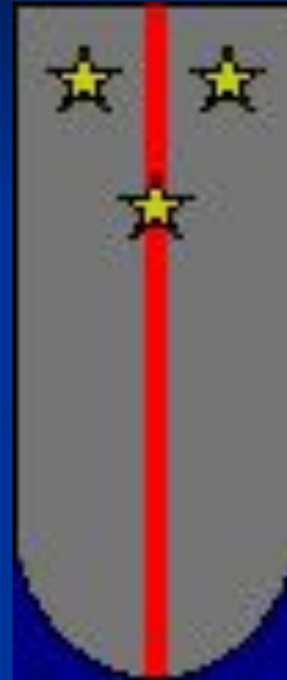
Погон ст. лейтенанта

ЛЕЙТЕНАНТ (франц. lieutenant), воинское звание младшего офицерского состава во многих государствах. Появилось во Франции в 15 в., где так называли офицера, замещавшего своего начальника. Со 2-й пол. 17 в. во Франции и других европейских государствах чин в армии и флоте. В России чин лейтенанта существовал с нач. 18 в. на флоте; с 1907 был также чин старший лейтенант. В Советских Вооруженных Силах в 1935 были введены звания лейтенант и старший лейтенант, в 1937 — младший лейтенант; сохранилось в Вооруженных Силах Российской Федерации.