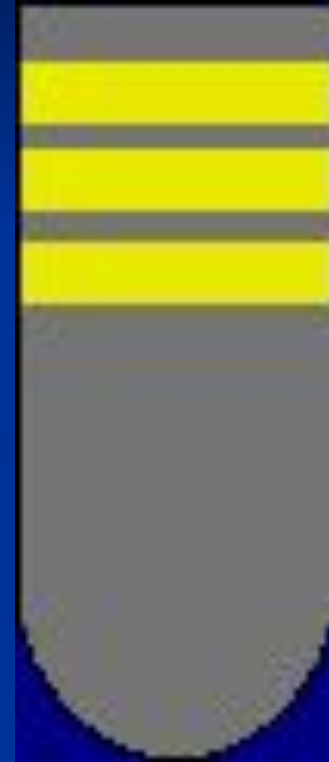
Погон ст. сержанта

СЕРЖАНТ (франц. sergent, от лат. serviens — служащий), воинское звание в Вооруженных Силах Российской Федерации и многих иностранных государств. В СССР с 1940 существовали звания младший сержант, сержант и старший сержант; сохранены в Вооруженных Силах Российской Федерации. В русской армии с 17 в. по 1798.