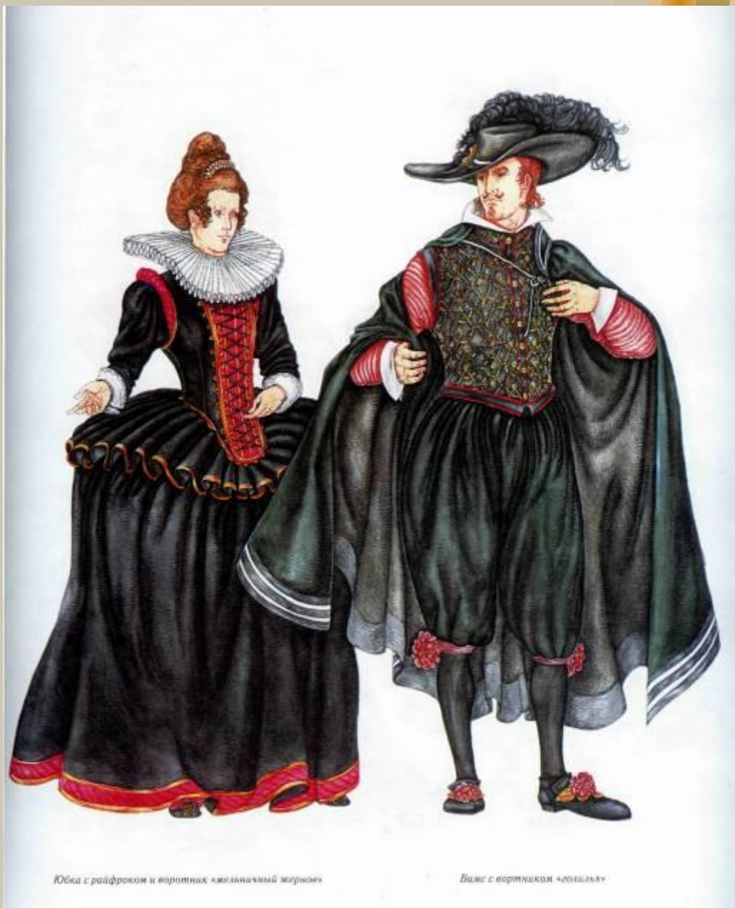
Юбка с райфромом и воротник «железничий жернов»