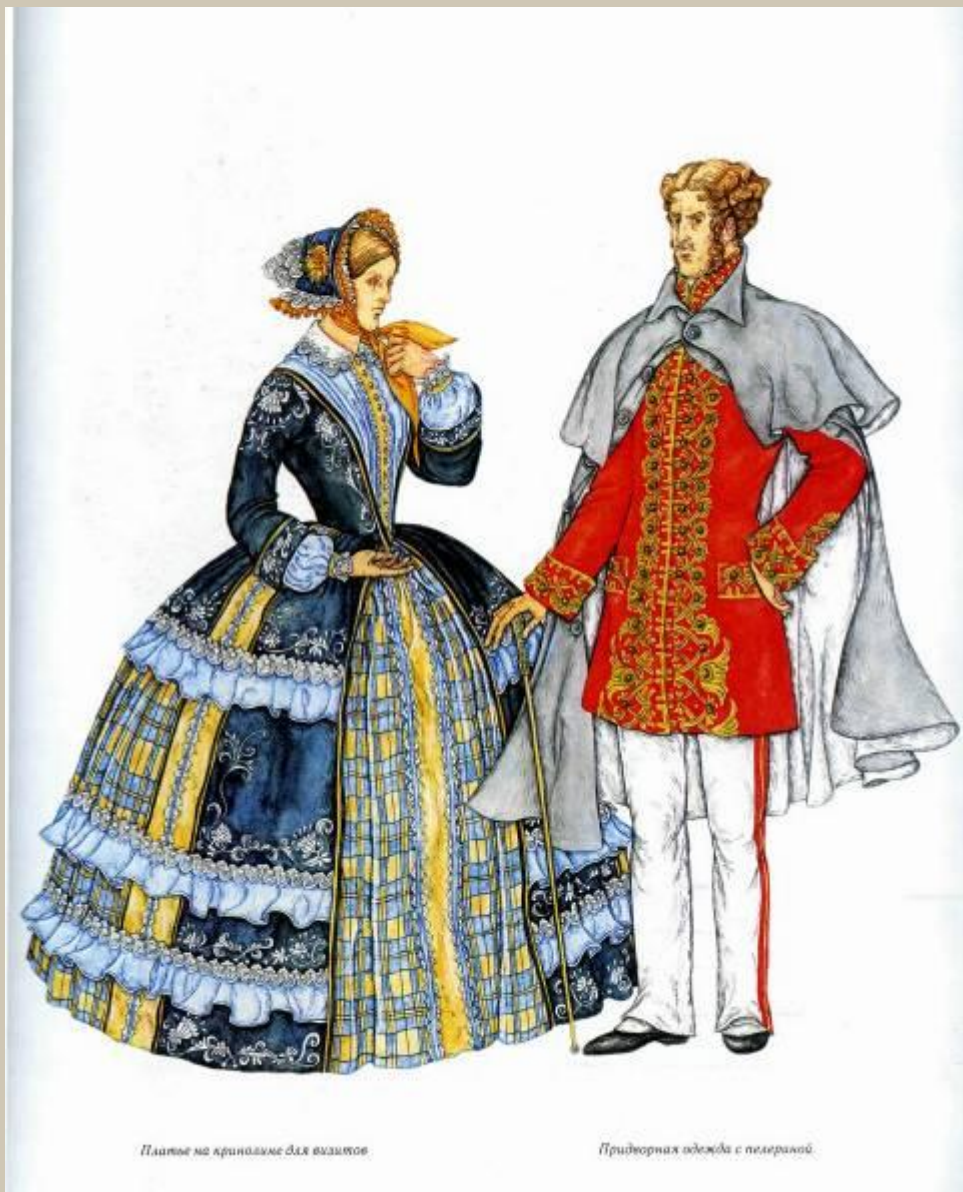
Платье на кринолине для визитов