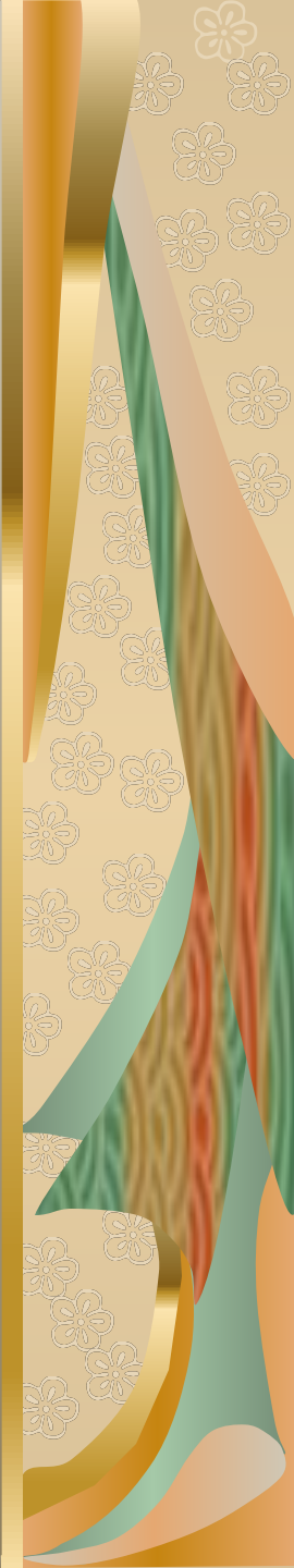
Придворная одежда с пелеравой