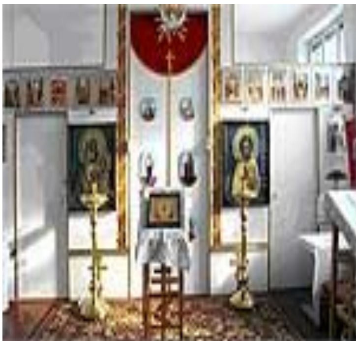
Приход в честь Преображения Господня