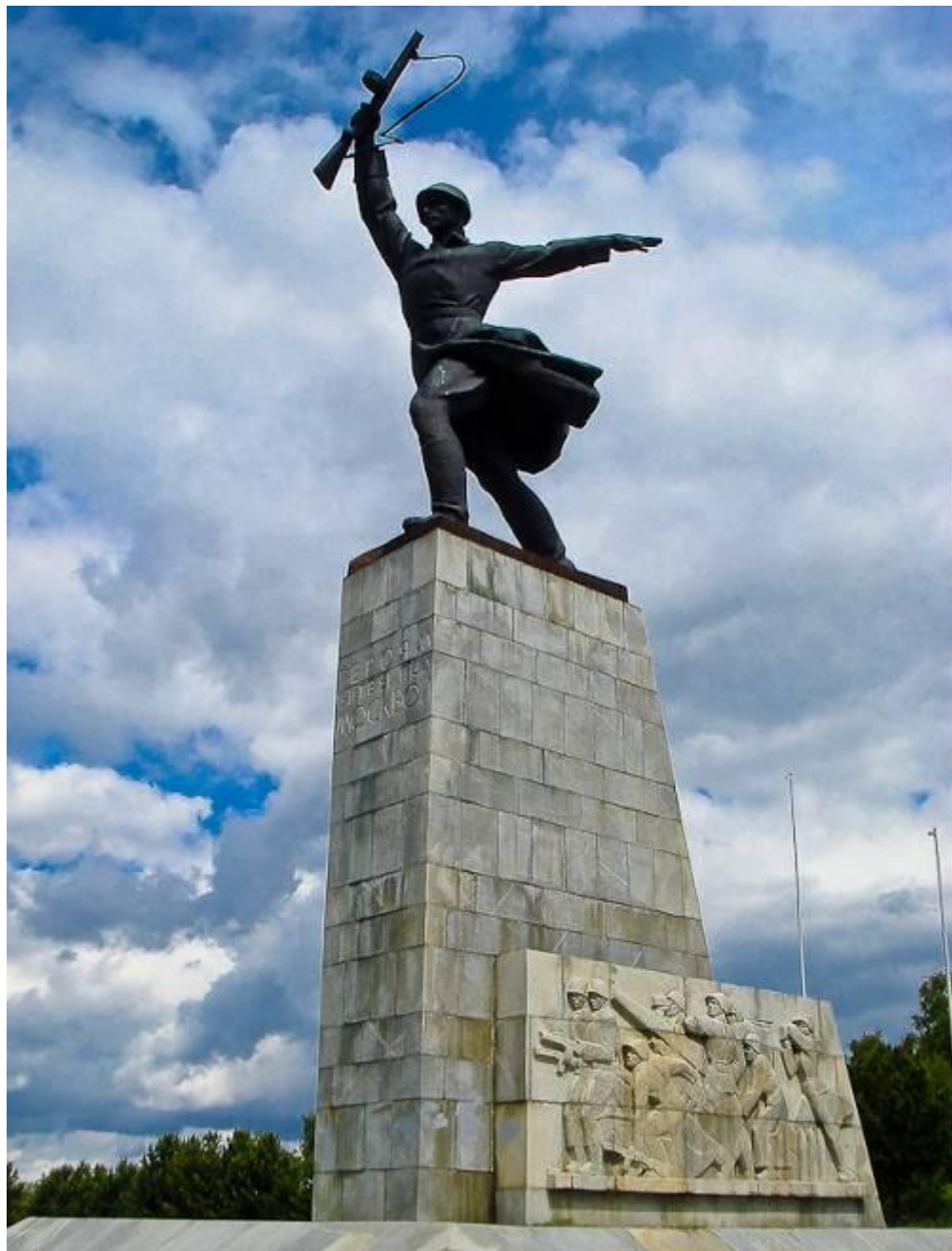
Перемиловская высота. Монумент защитникам Москвы. г. Яхрома.