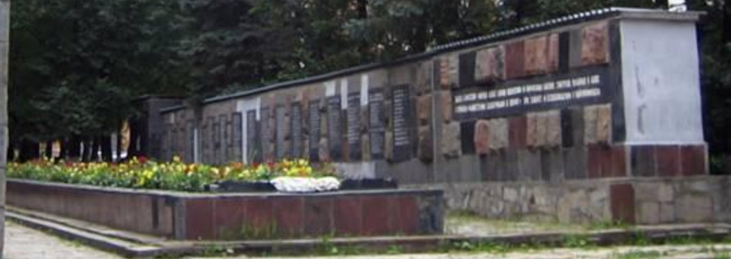
Мемориальный комплекс на братской могиле воинов 33-й армии г. Наро-Фоминск