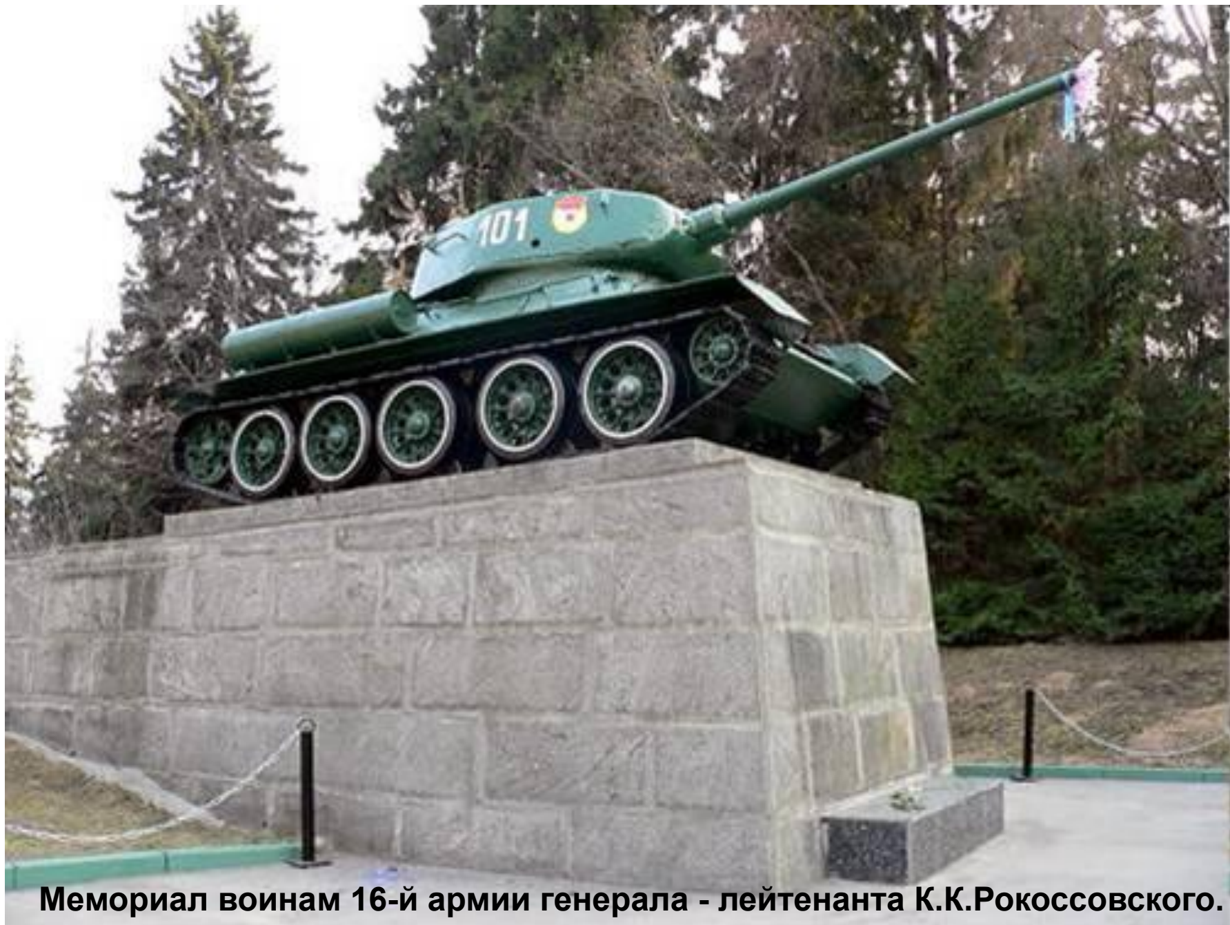
Мемориал воинам 16-й армии генерала - лейтенанта К.К.Рокоссовского.