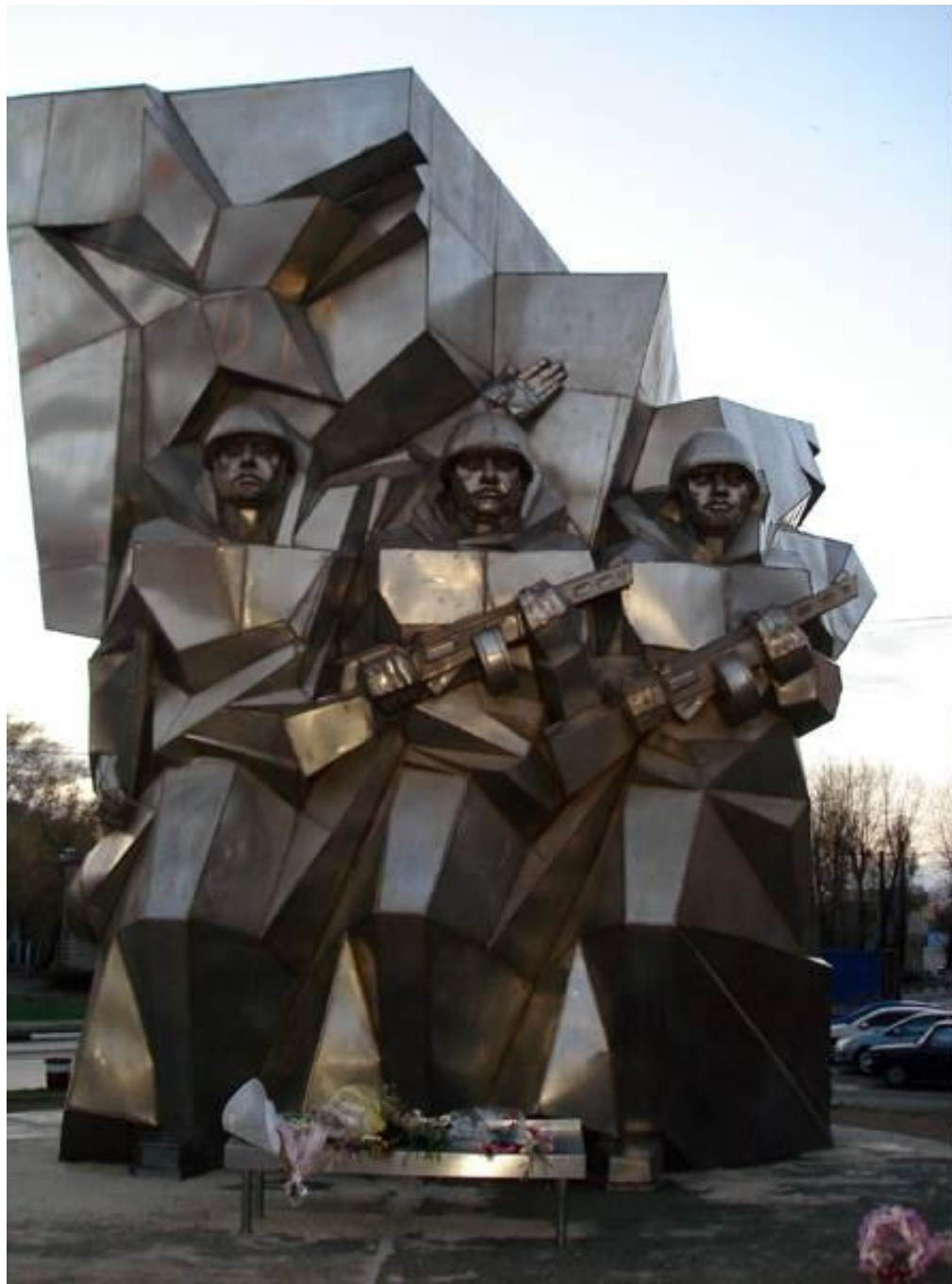
Памятник Подольским курсантам, погибшим под Москвой