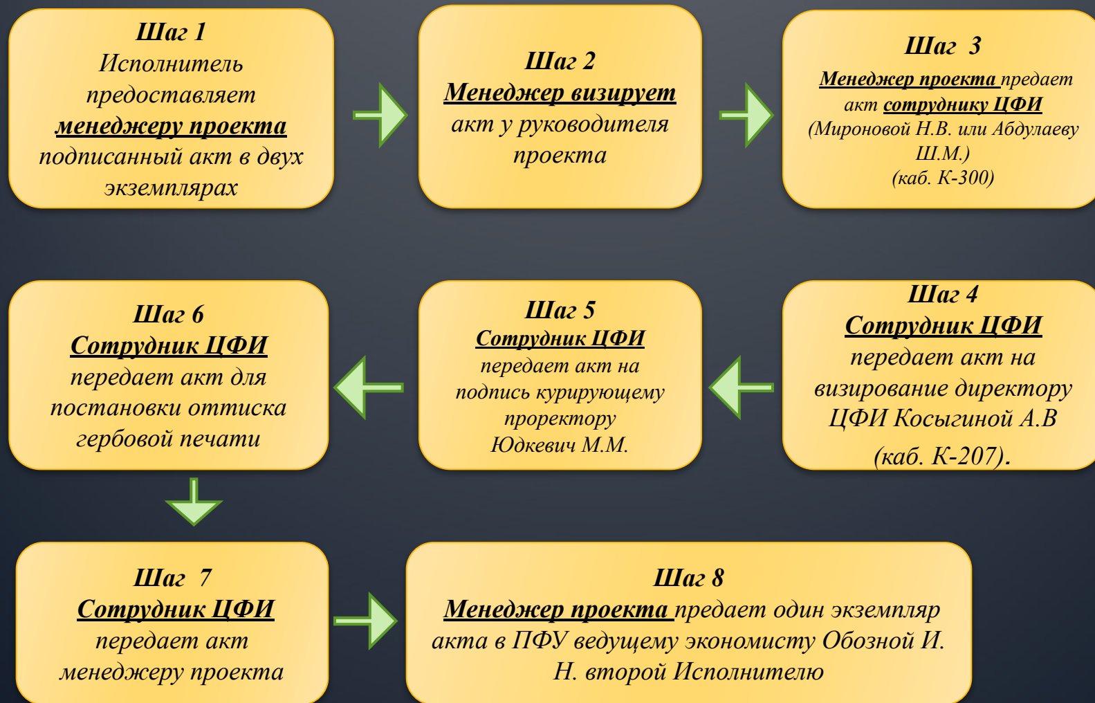
схема визирования акта сдачи-приемки работ (оказания услуг)