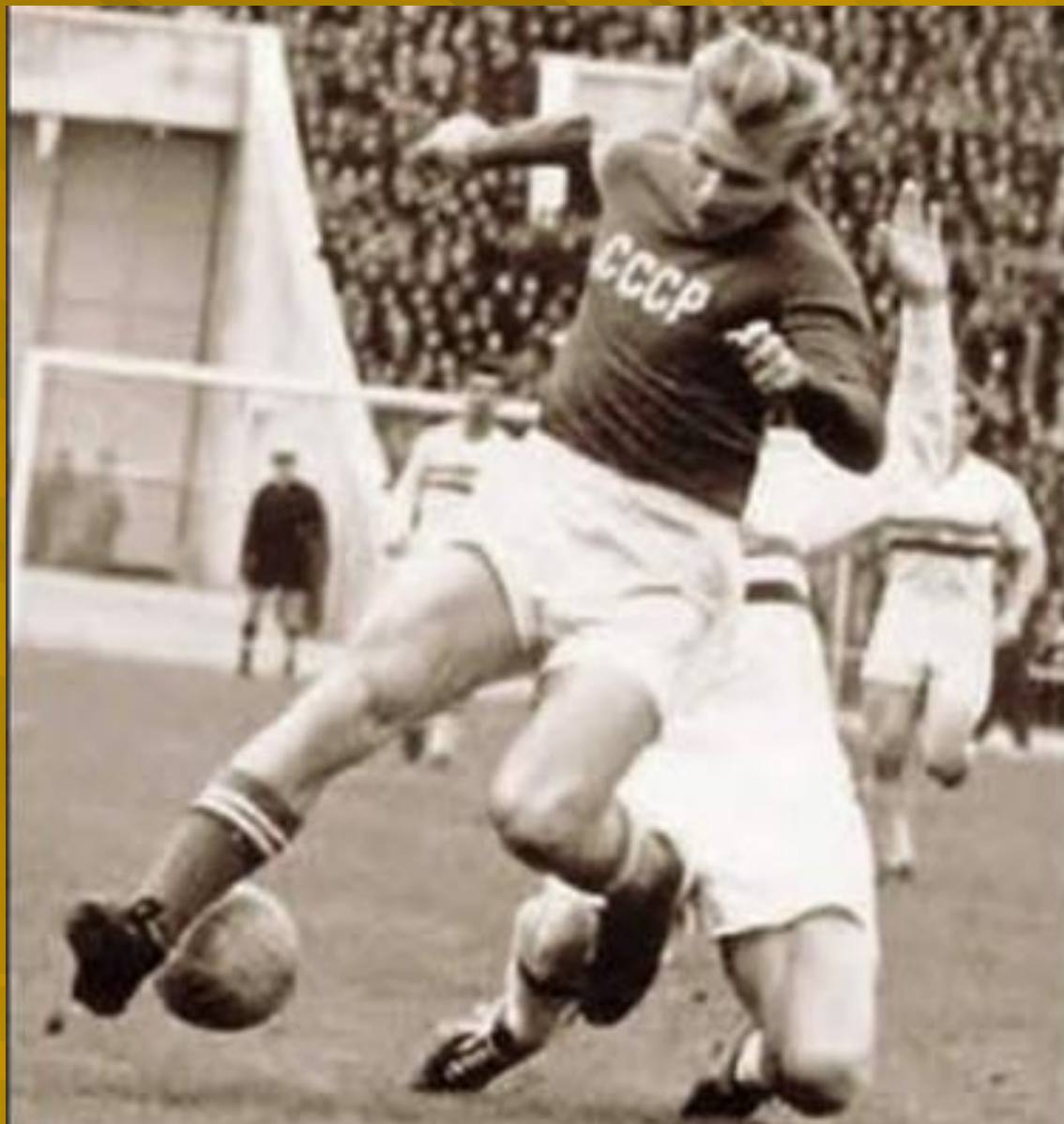
Пас пяткой «по –стрельцовски»