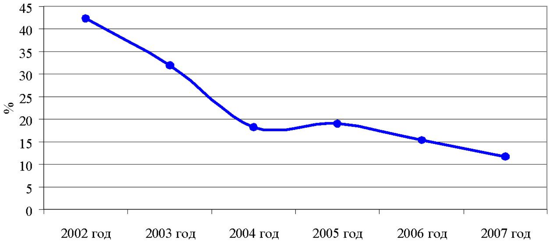
Государственный долг к доходам республиканского бюджета Республики Коми