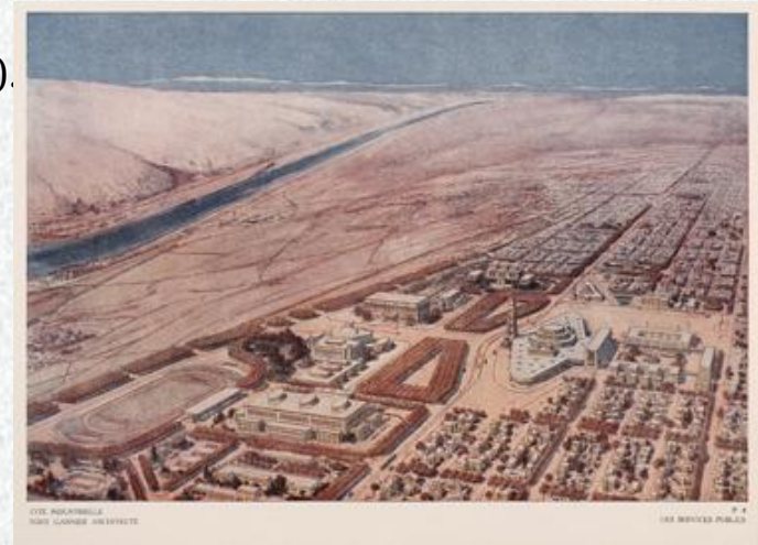
Цветная панорама индустриального города-утопии Гарнье

В дальнейшем идея функционального разделения была принята членами CIAM, и значительно повлияла на проектирование городов (пример - Бразилиа).