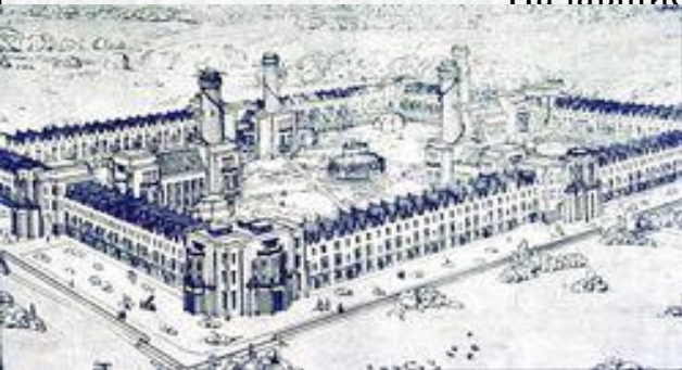
Вид коммуны Новая Гармония

овано несколько поселений по подобной схеме – Орбистон, овая Гармония в Индиане, и др., но существовали