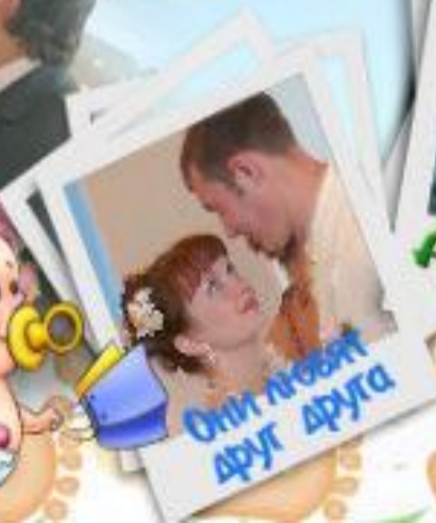
Они любят друг друга