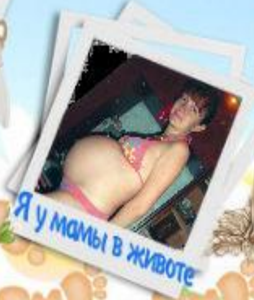
Я у мамы в животе