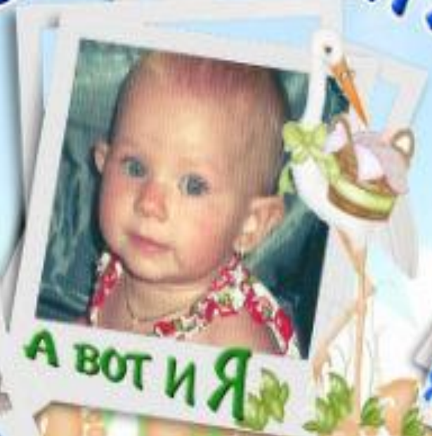
А вот и Я