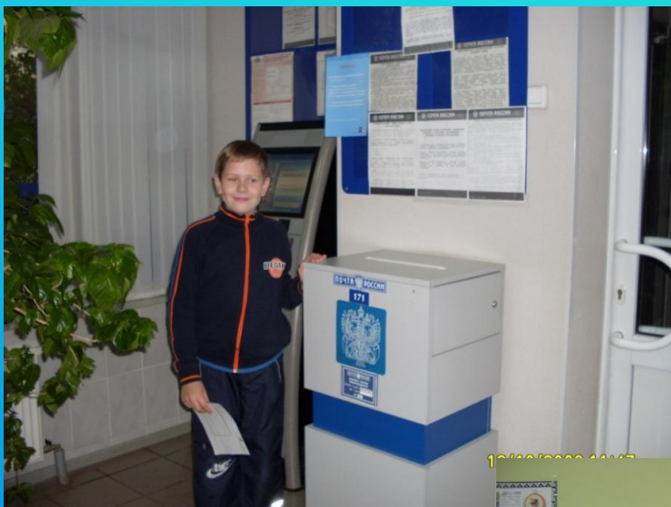
Почтовая связь в России