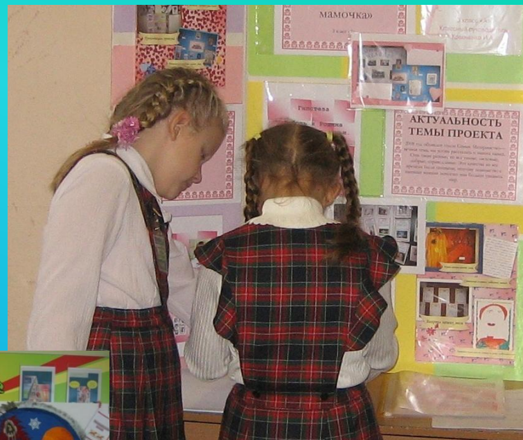
Профессии наших мам