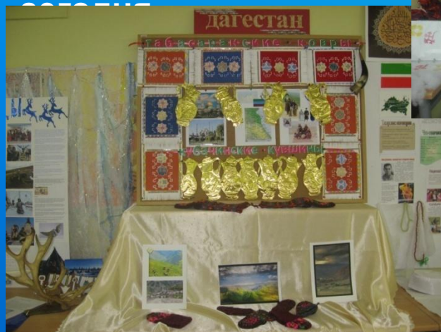
ИЗУЧЕНИЕ КУЛЬТУРЫ И НАСЛЕДИЯ МАЛЫХ НАРОДОВ РОССИИ