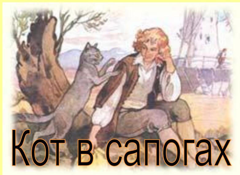
Кот в сапогах