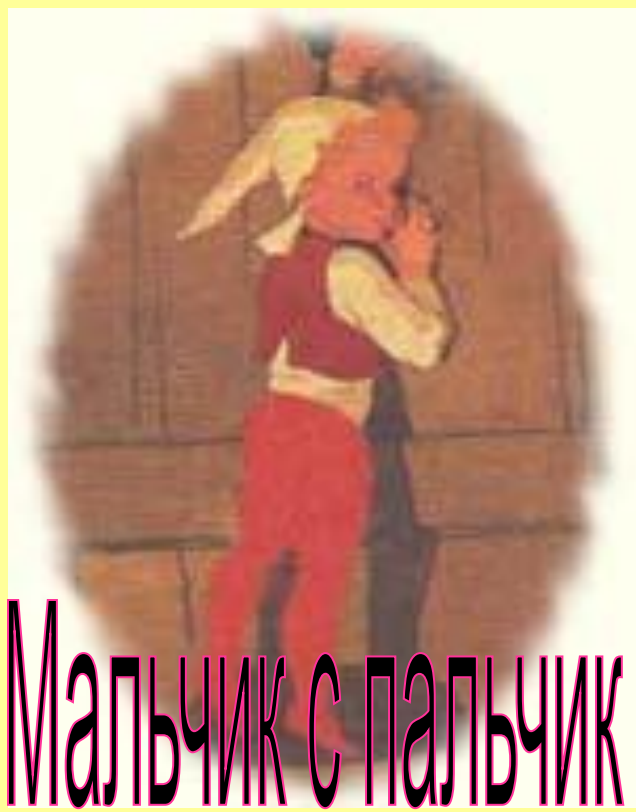
Мальчик с пальчик