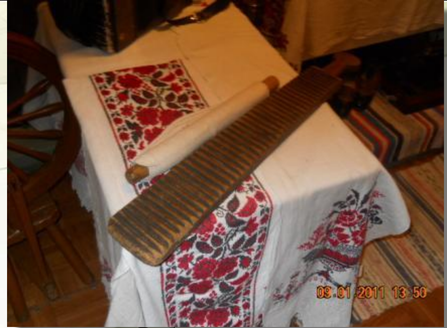
Рубель и каталка