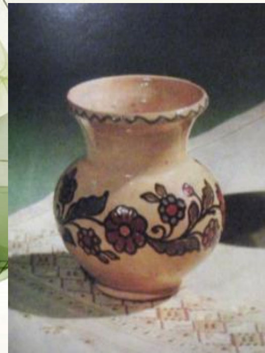
Кувшины и глечик ( музей МОУ СОШ №12)