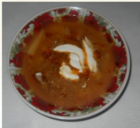
Борщ со сметаной