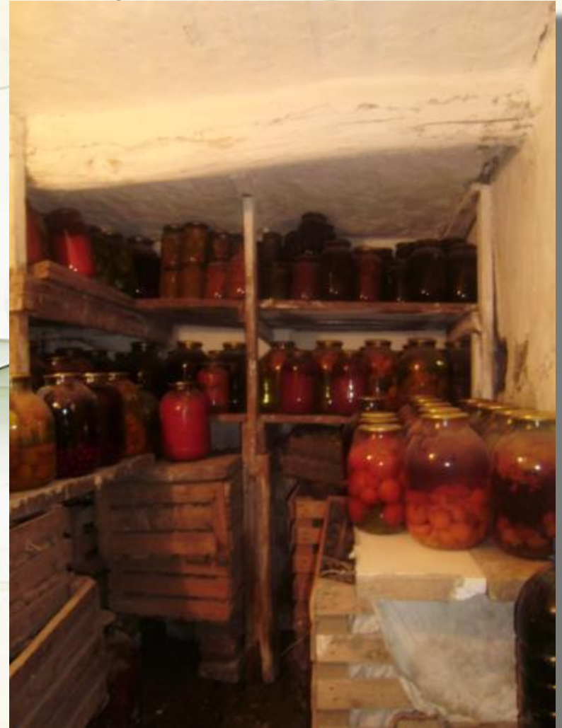
Погреб - подвал