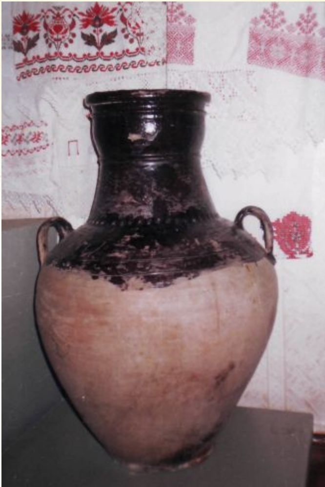
Кубган (районный музей)