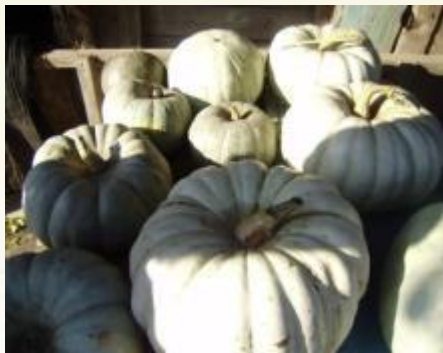
Гарбуз - тыква