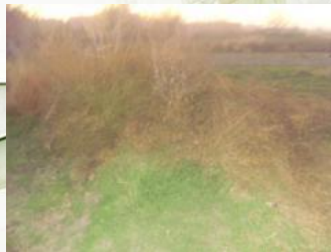
Бурьян - сорная растительность