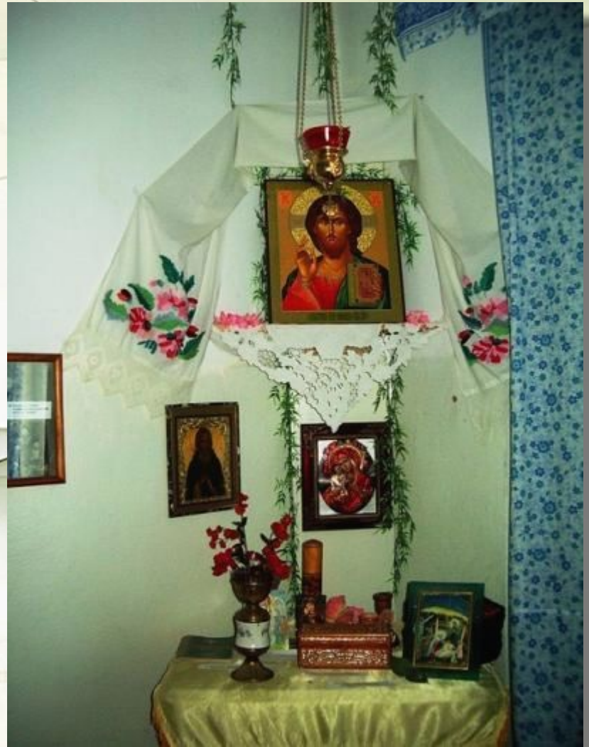
Красный угол в хате