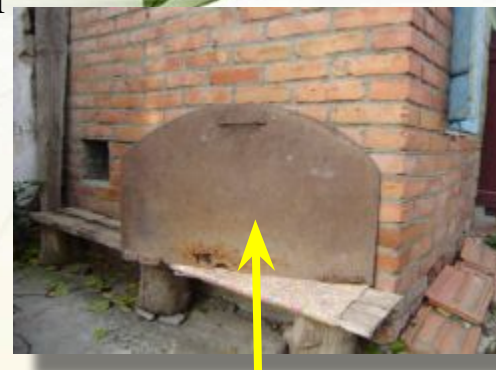
Заслонка для печи