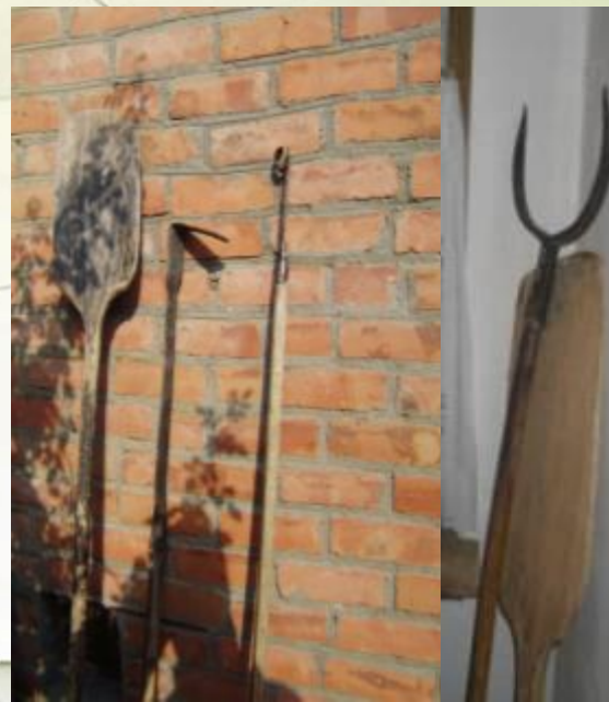
Деревянная лопата, кочерга, чапля, рогач.