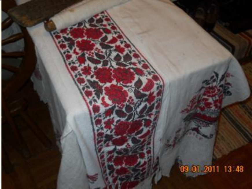
Настольник - скатерть