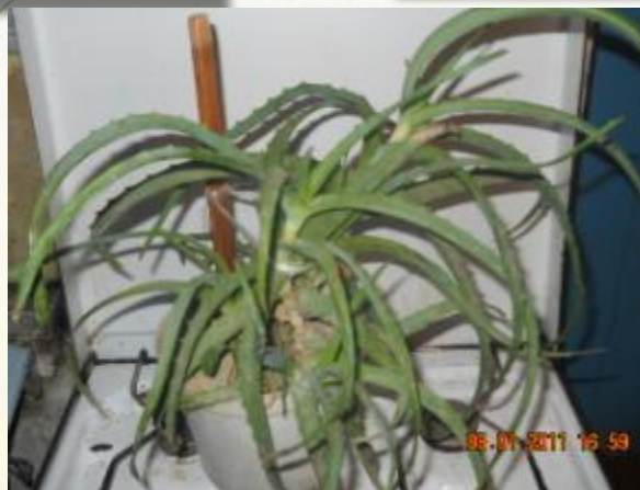
Рашпиль - алоэ