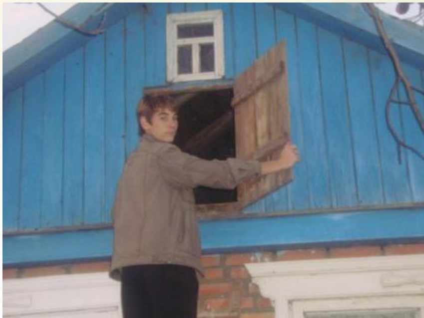
Вход на горище