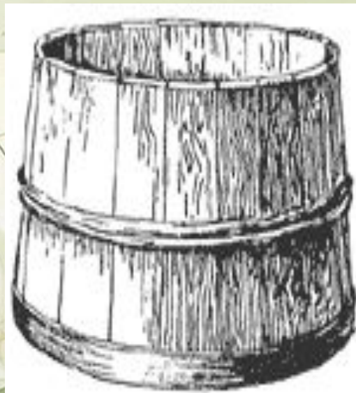
Дежка - посуда для приготовления теста