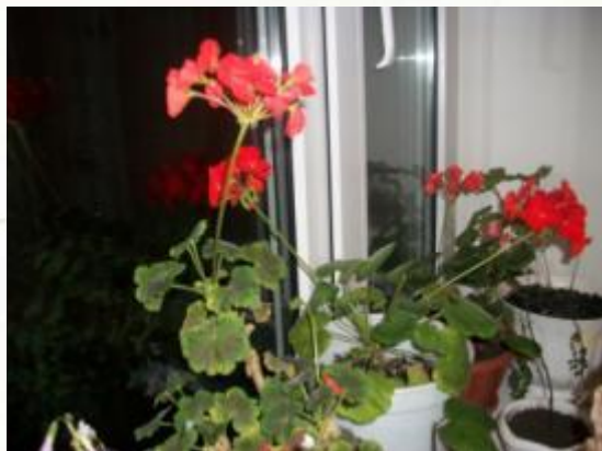
Калачик - герань