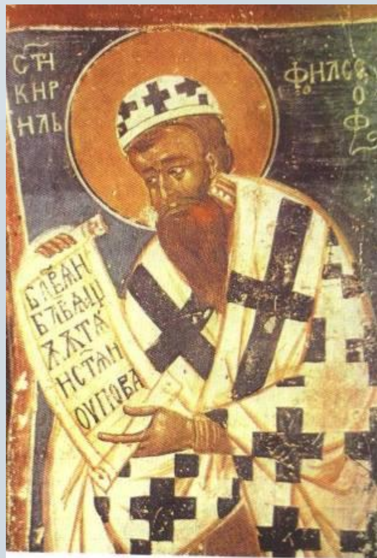
Святой Кирилл. Фреска церкви Апостола Петра. XIII в. Болгария