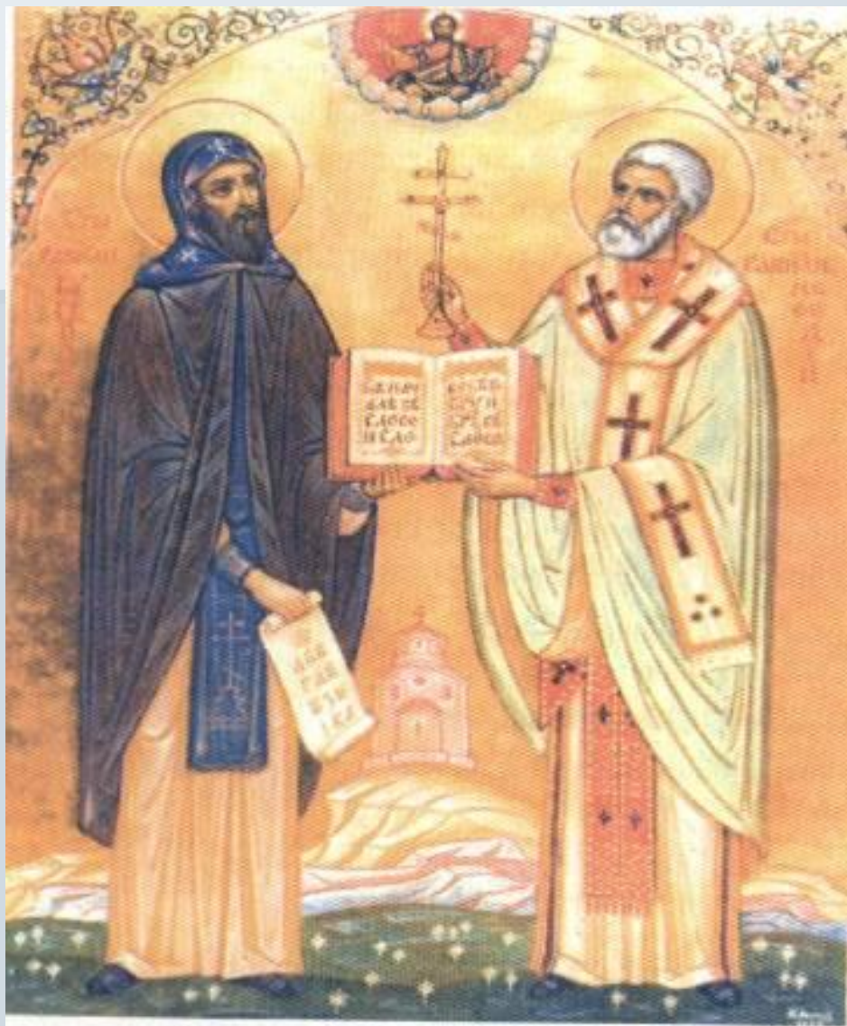
Святые Кирилл и Мефодий. Икона. 1969 г.