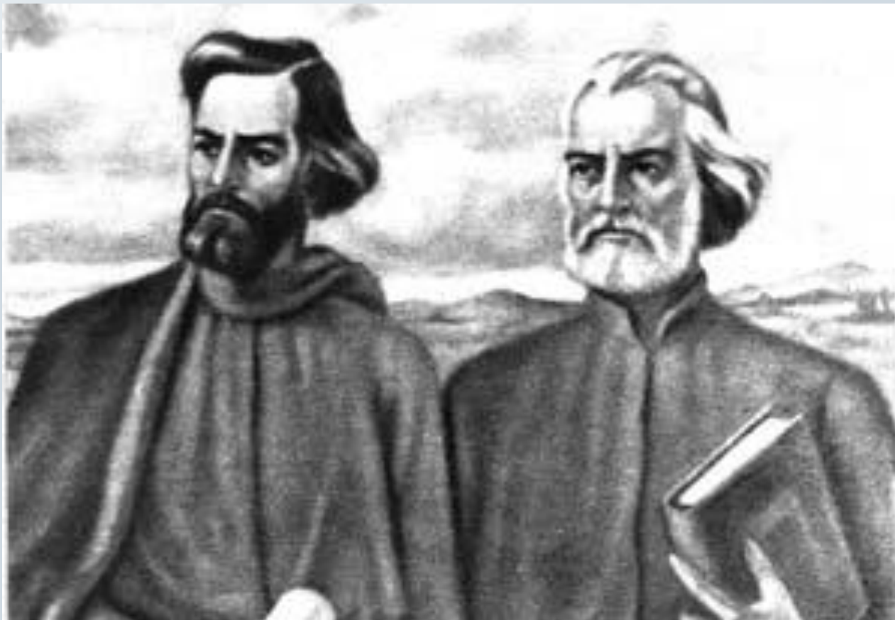
Константин и Мефодий