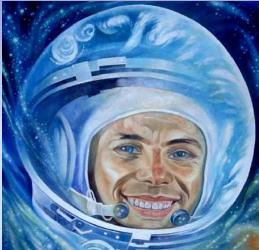
Юрий Алексеевич Гагарин (9.03.1934-27.03.1968)