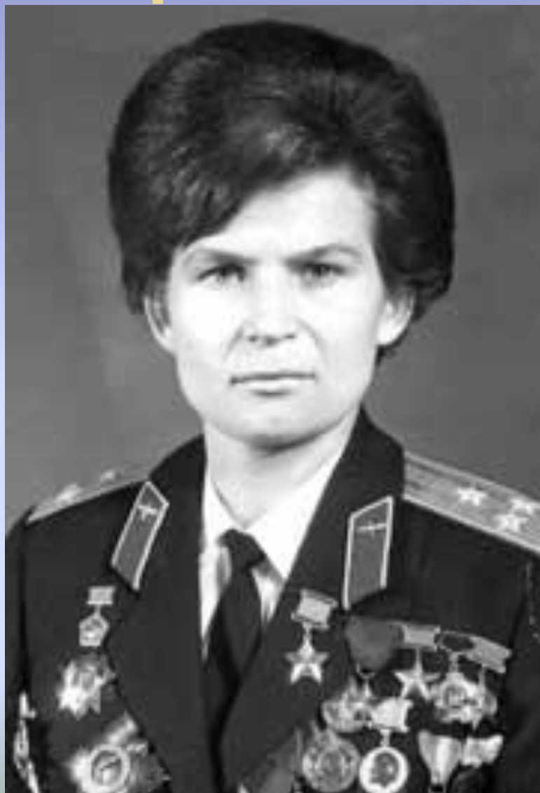
Валентина Владимировна Терешкова (6марта 1937г.)