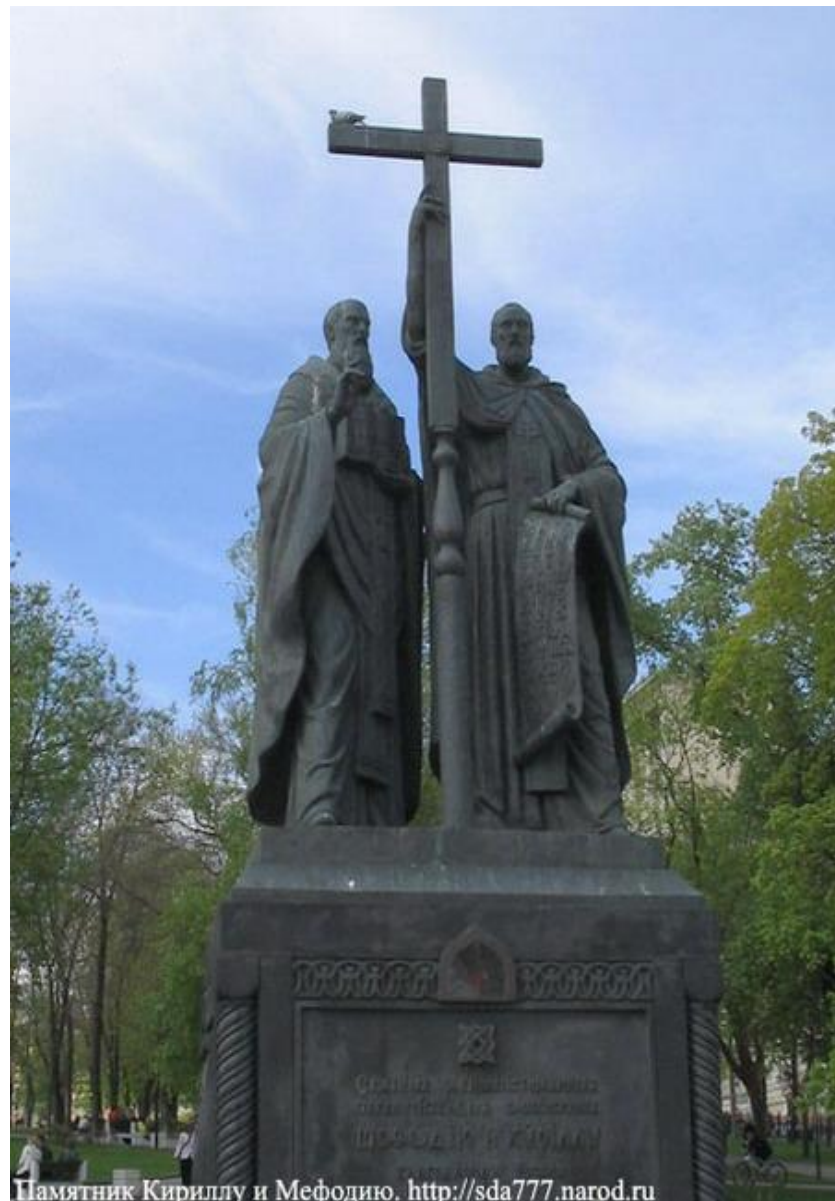
Памятник Кириллу и Мефодию. http://sda777.narod.ru

А помогал ему в богоугодном деле образования славянских народов старший брат Мефодий.