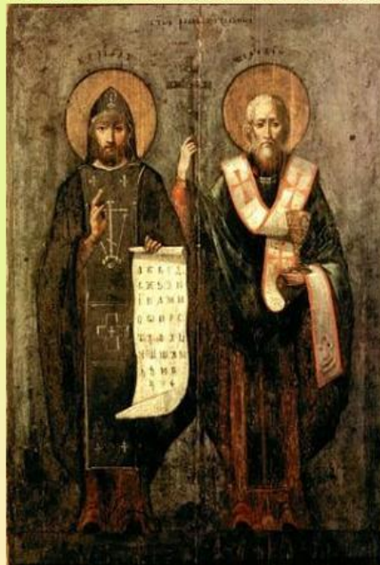
Кирилл и Мефодий – создатели славянской азбуки