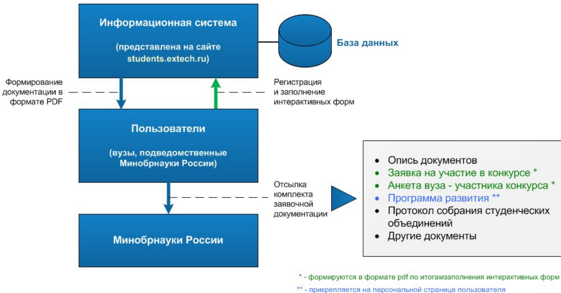
Схема информационного взаимодействия