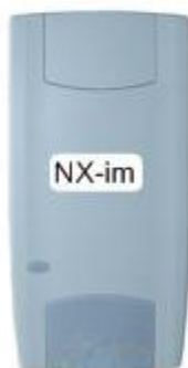
Внутренний датчик движения