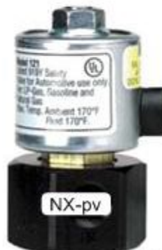
Электромеханический газовый клапан