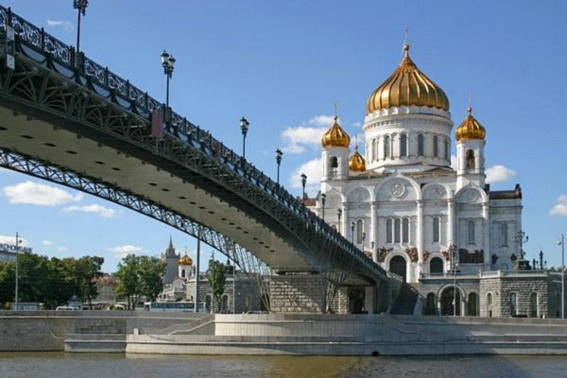
Храм Христа Спасителя г.Москва