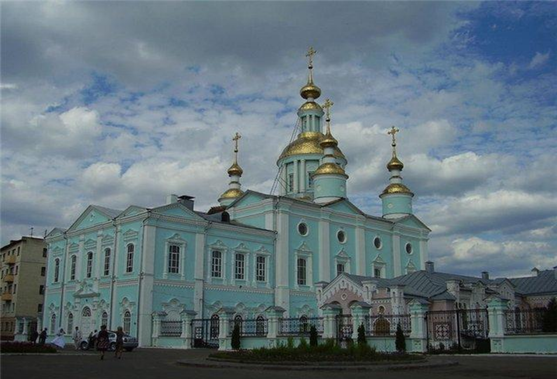
Спасо-Преображенский собор г.Тамбов