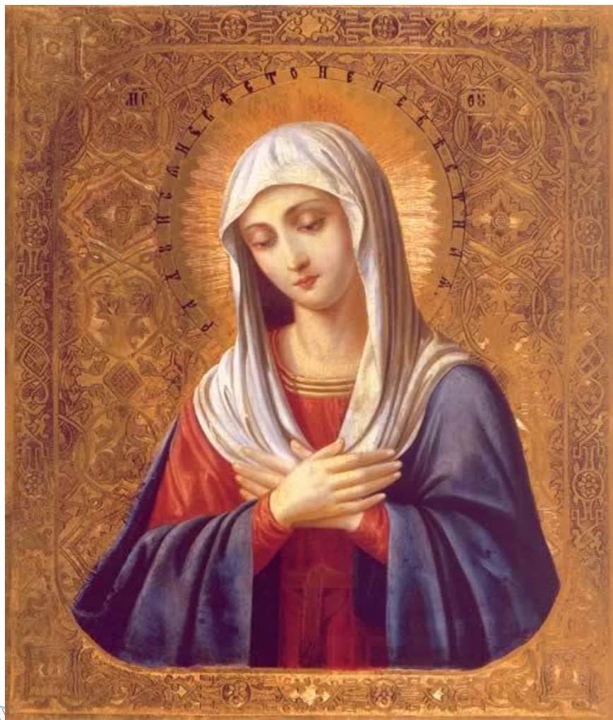
Пресвятая Богородица Умиление