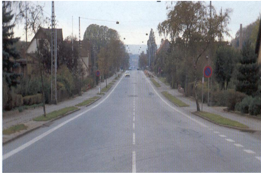
Haderslevvej before the conversion.