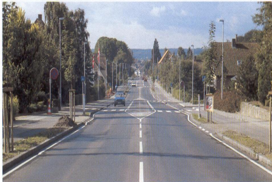
The traffic island shields off the left-turn lane and provides for safer crossing of the road.