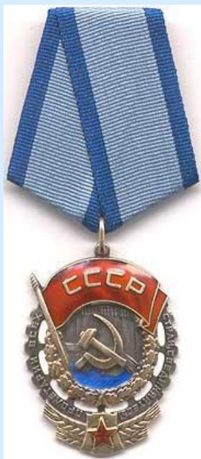
Орден Трудового Красного Знамени