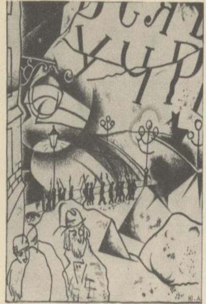
Иллюстрация Ю. Анненкова к поэме «Двенадцать».

Композиционно поэма разбита на двенадцать главок, последовательно развертывающих сюжет. Двенадцать — враги старого мира, но они сами вышли из него, сформировались в его недрах, не могут сразу избавиться от его «родимых пятен». Поэт символически передает это образом старого мира — «пса безродного», который не отстаёт от них, ковыляет позади. В них бушуют и темные страсти. Их охватывает пьянящее ощущение, что «все дозволено»: «Свобода, свобода, эх, эх, без креста!» Поначалу в их облике запечатлены черты не пролетарского авангарда, а анархистствующей вольницы. Автор не «приподнимает» своих героев, показывает грубость и стихийность буйной ватаги. Блок, однако, приветствует происходящее. Он благословляет очистительную силу огня революции и активность ее свершителей: «Мы на горе всем буржуям мировой пожар раздуем!»