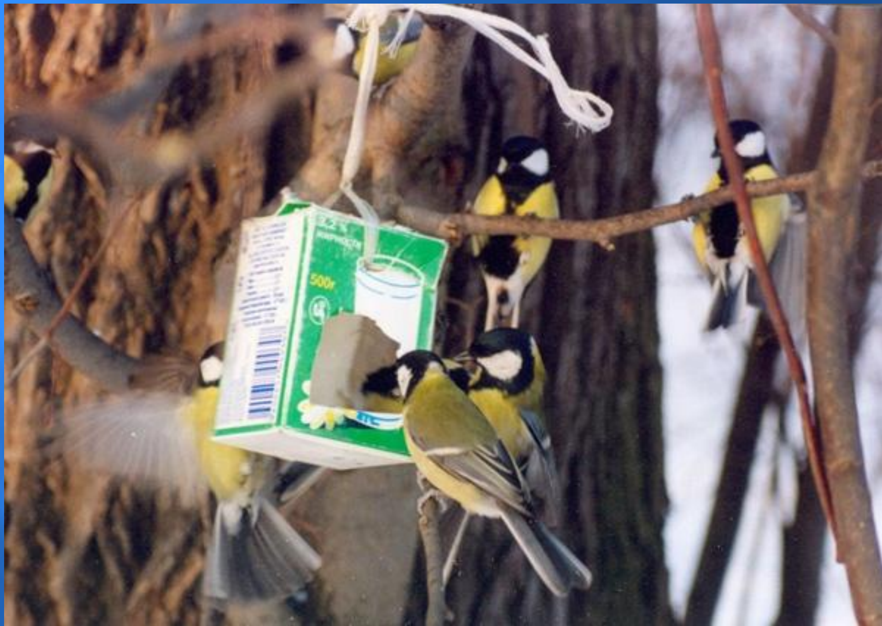
Перед стайкою синиц.