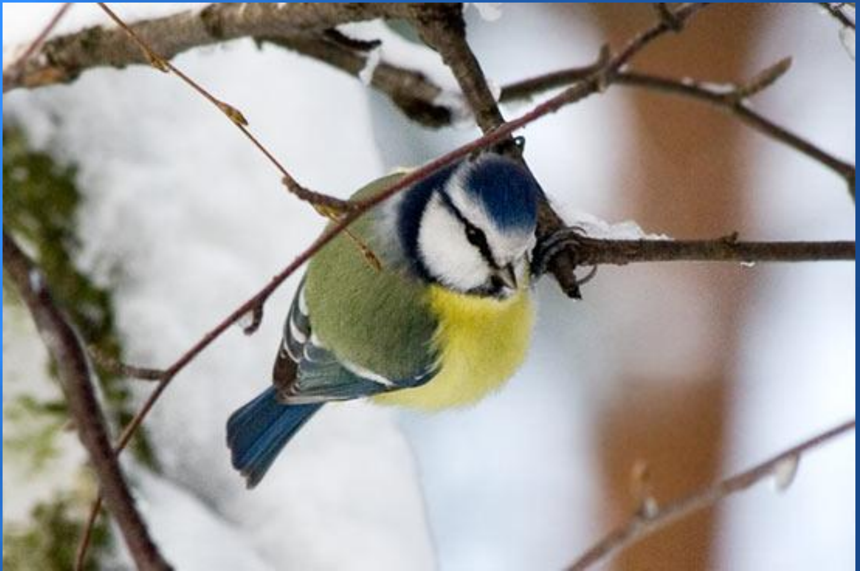
Красивая синичка – лазоревка.