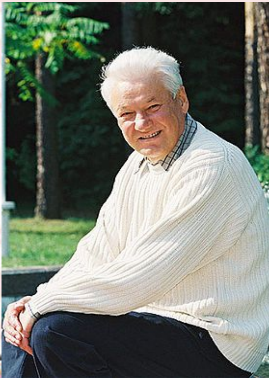
Ельцин Борис Николаевич