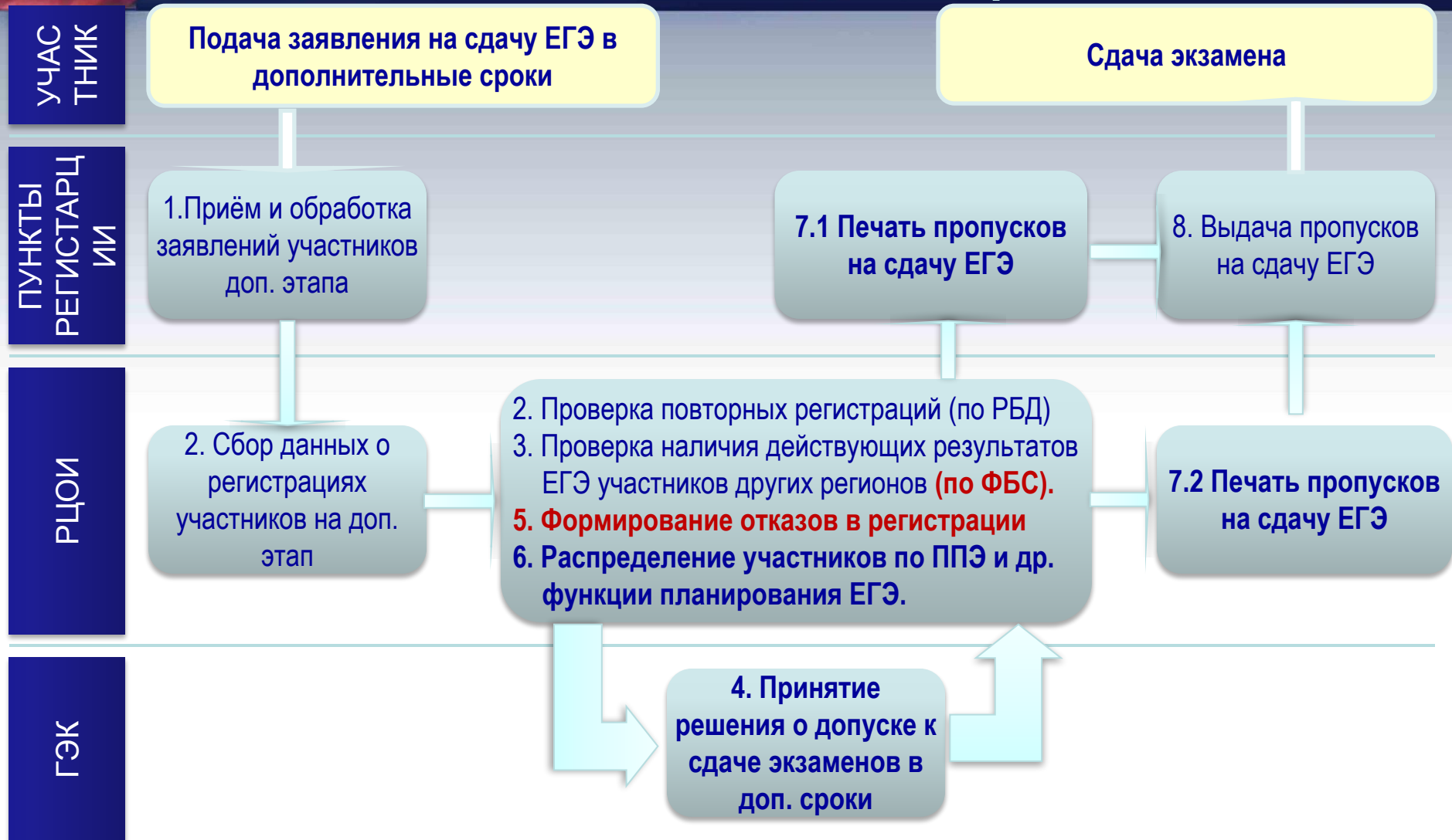
Схема регистрации участников и планирования проведения ЕГЭ в дополнительные сроки

Пункты регистрации участников дополнительного этапа могут создаваться на базе: вузов/ссузов, МОУО, ОУ, РЦОИ, ОУО