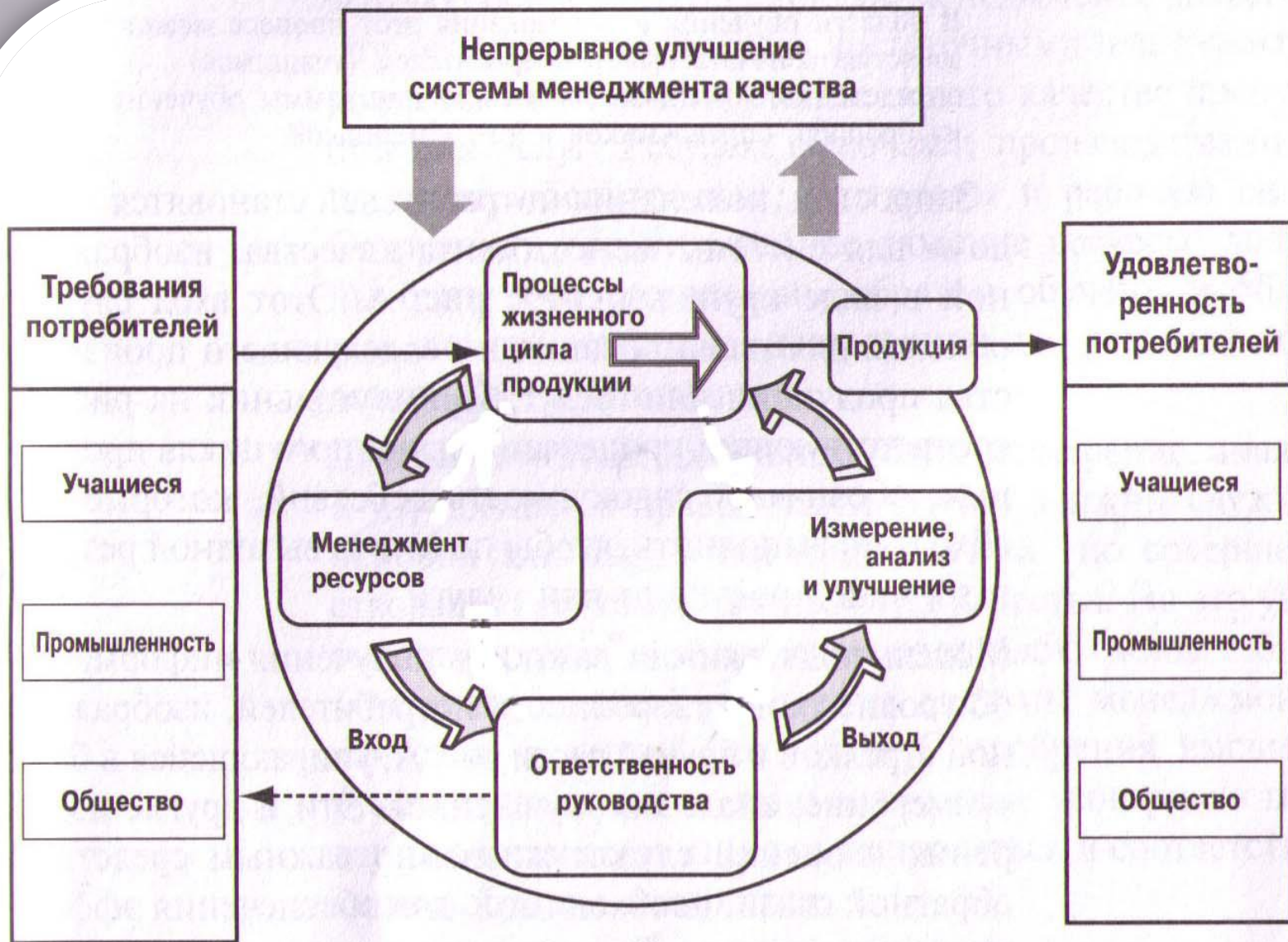
Модель процессного подхода