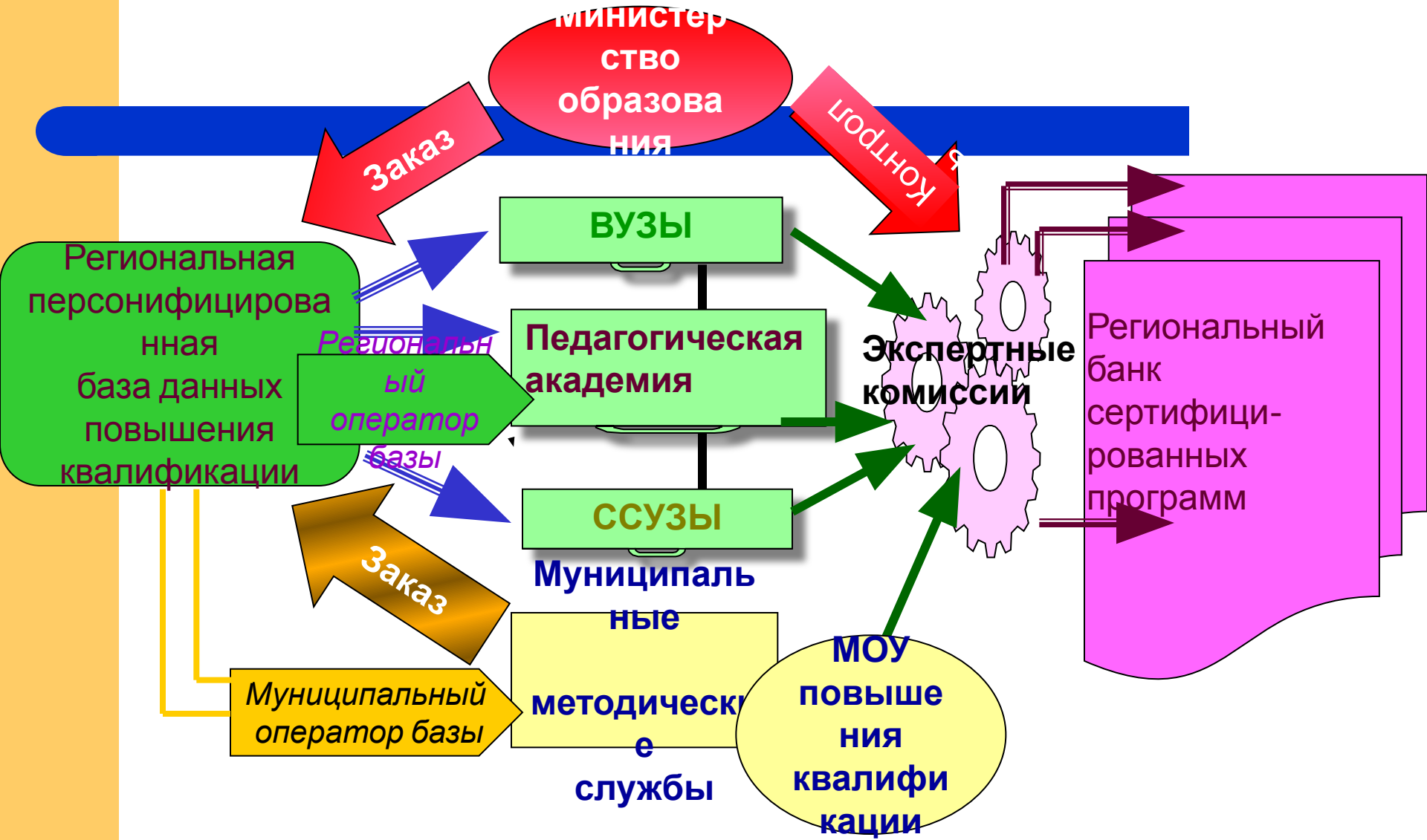
СХЕМА РЕГИОНАЛЬНОГО СЕТЕВОГО ВЗАИМОДЕЙСТВИЯ В ОБЛАСТИ ПОВЫШЕНИЯ КВАЛИФИКАЦИИ РАБОТНИКОВ ОБРАЗОВАНИЯ