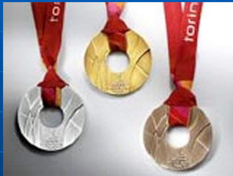
Медали олимпиады в Турине, 2006