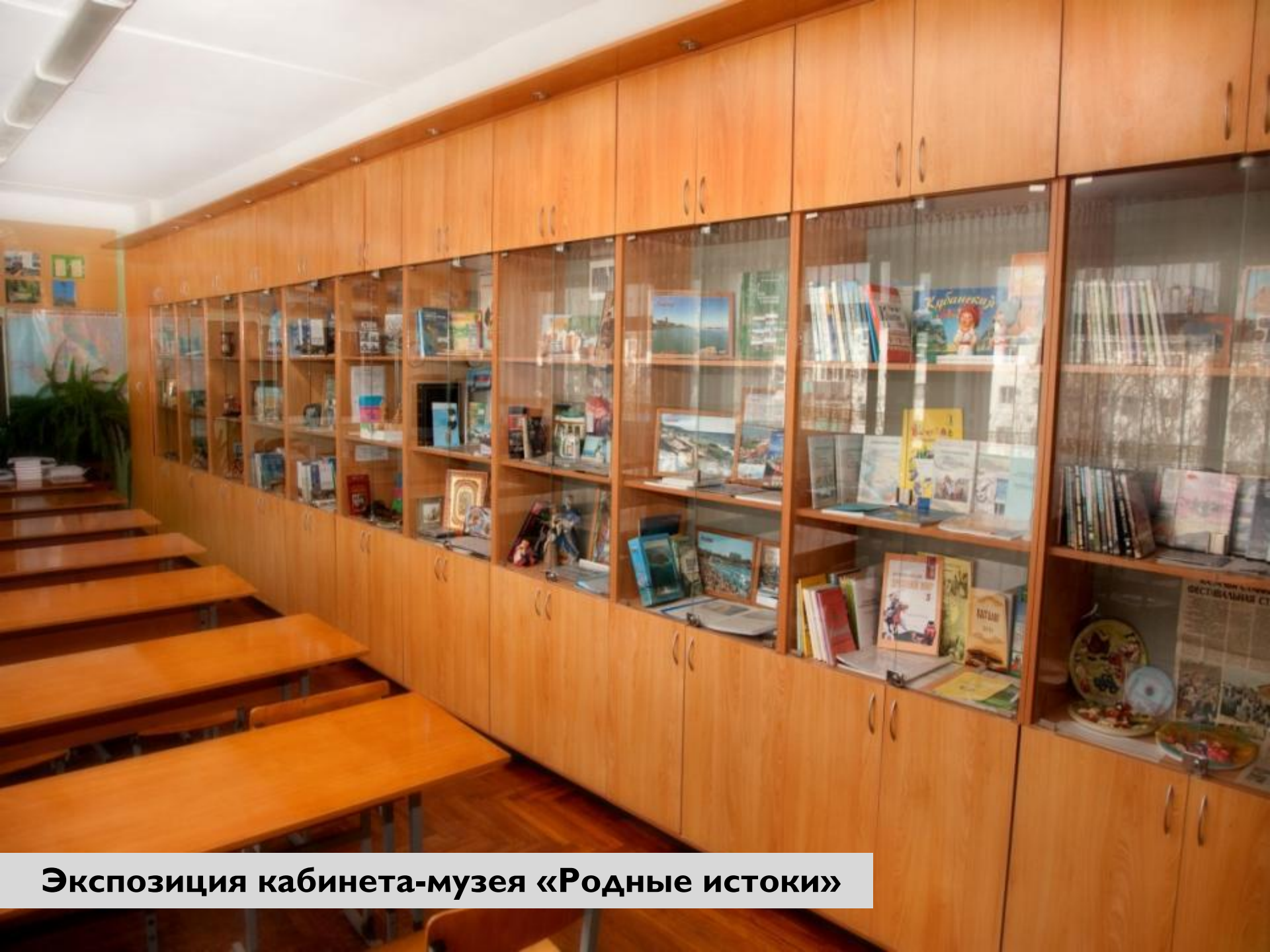
Экспозиция кабинета-музея «Родные истоки»