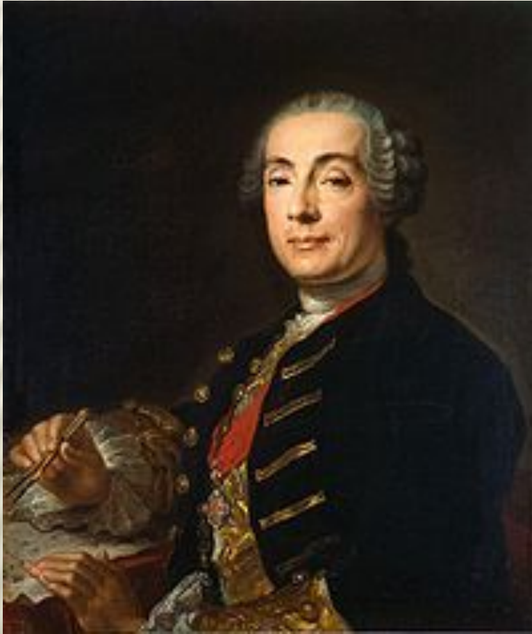
Франческо Бартоломео Растрелли (1700-1771 гг)

Сын известного скульптора и архитектора Бартоломео Карло Растрелли (1675—1744), обрусевшего итальянца.