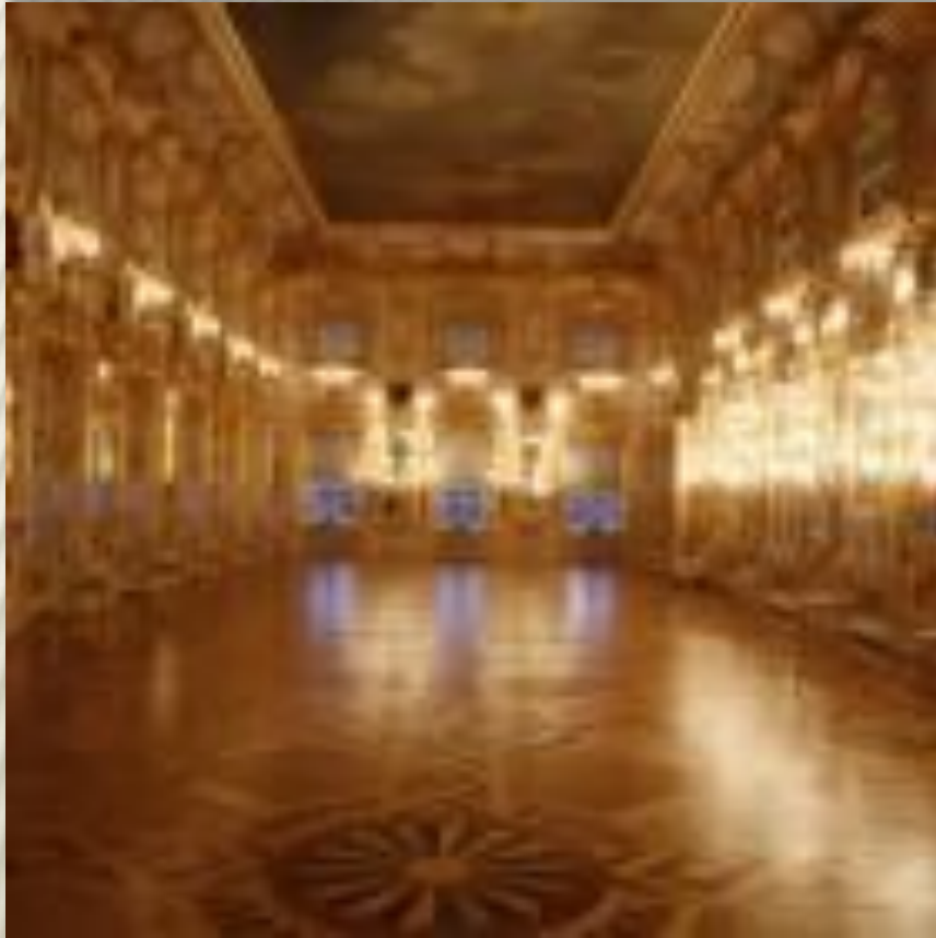
Танцевальный зал архитектор Б. Ф. Растрелли .

Для интерьеров, созданных гением Растрелли характерно обилие деревянной золоченой резьбы, наборные паркетные полы из разных пород ценной древесины, множество зеркал и живописные плафоны на потолках.