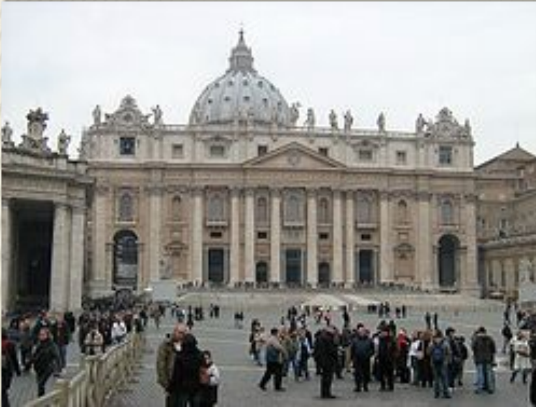
Архитектор Джованни Лоренцо Бернини