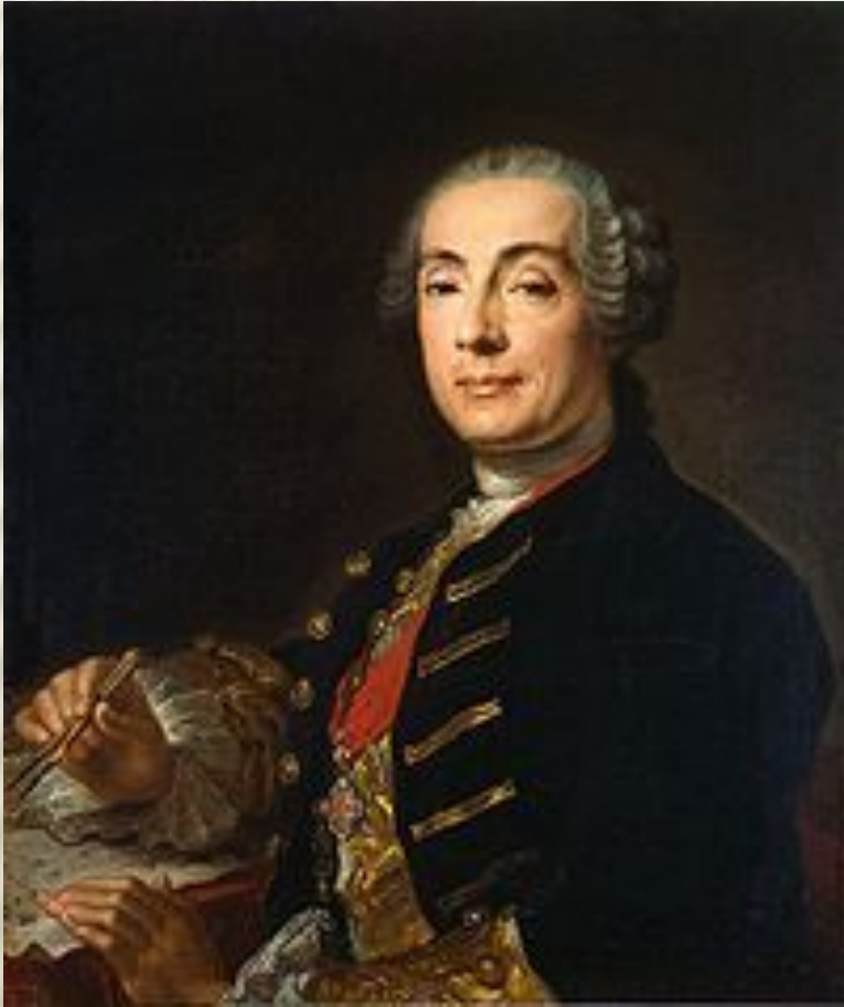
Франческо Бартоломео Растрелли (1700-1771 гг)

Сын известного скульптора и архитектора Бартоломео Карло Растрелли (1675—1744), обрусевшего итальянца.