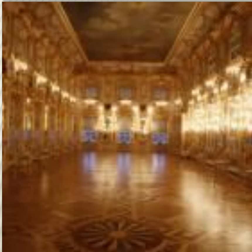
Танцевальный зал архитектор Б. Ф. Растрелли .

Для интерьеров, созданных гением Растрелли характерно обилие деревянной золоченой резьбы, наборные паркетные полы из разных пород ценной древесины, множество зеркал и живописные плафоны на потолках.