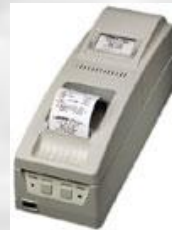
DATECS FP3530 T